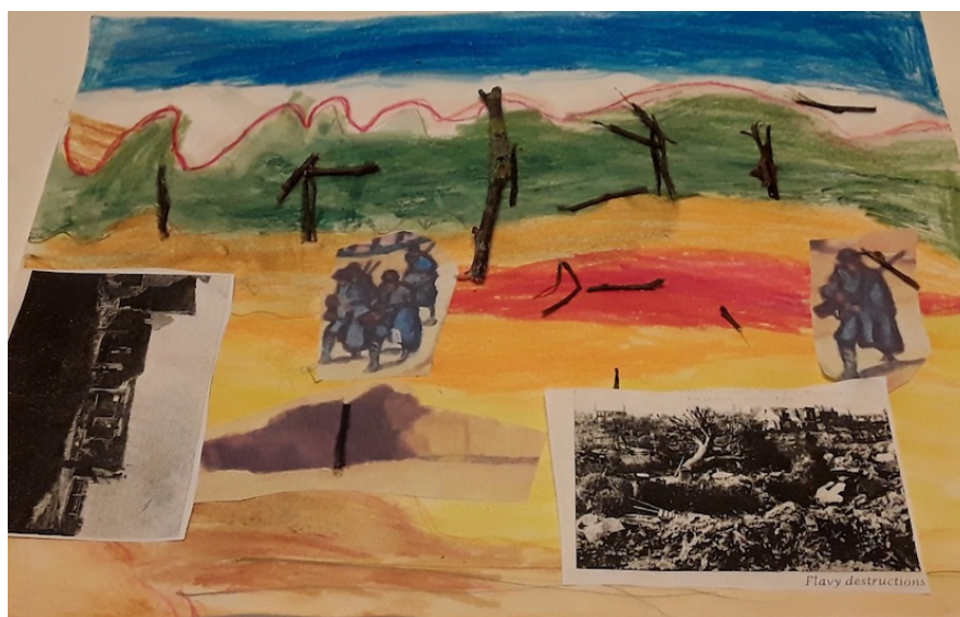
Une des œuvres réalisées dans la classe CM1 (toutes les œuvres ont été exposées le 15 octobre à Grugies et le 11 novembre à Flavy)

C'est avec la plus grande satisfaction que nous les encourageons à poursuivre ce travail de mémoire, en saluant le dévouement des personnes qui les encadrent.