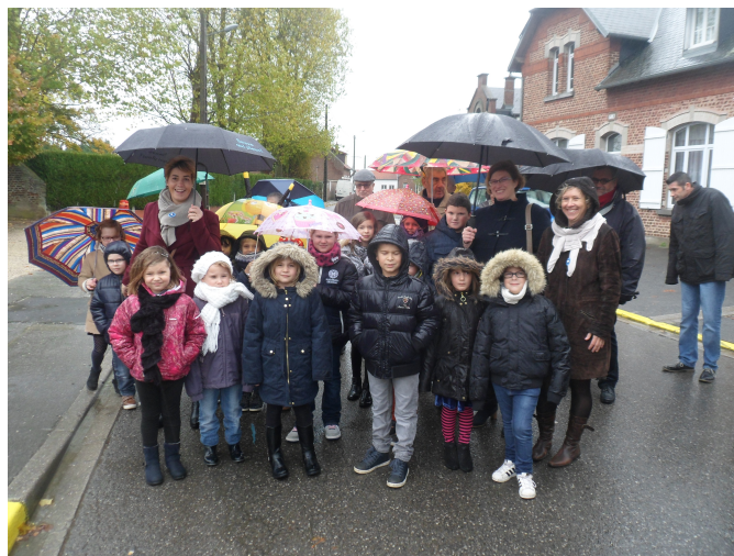
Au monument aux Morts, le 11 novembre 2017