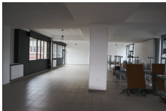
Salle polyvalente du bas agrandie et restaurée