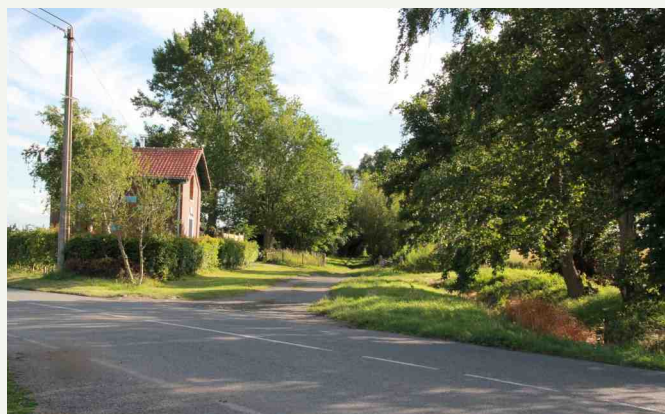
carrefour des 6 chemins