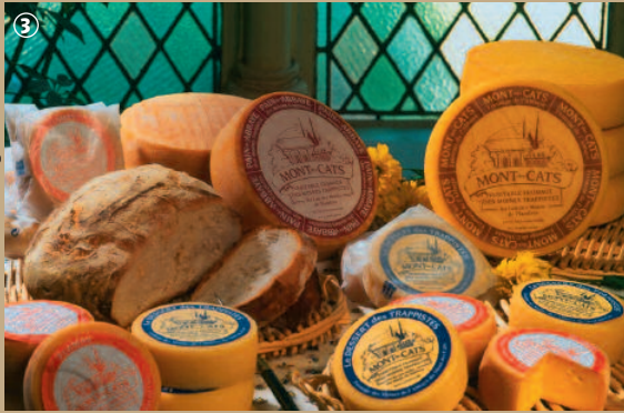
Fromages du mont des Cats

En 1826, Nicolas Ruyssen fonde l'abbaye cistercienne Sainte-Marie-du-Monts au sommet du Mont des Cats. Rapidement, la communauté de moines trappistes se lance dans l'agriculture et l'élevage, installant sur les lieux une brasserie et une fromagerie. Restauré après la Première Guerre Mondiale, l'édifice actuel, de style néogothique, abrite toujours la communauté, qui hors des heures de prière, nous concocte un fromage à pâte pressée non cuite, crémeux et généreux, célèbre en Flandres et même au-delà ! La seule partie de l'abbaye ouverte au public est la première chapelle des moines, devenue église paroissiale, ainsi que la chapelle « dite de la passion », dans laquelle se déroule toujours un pèlerinage très suivi le Vendredi Saint.