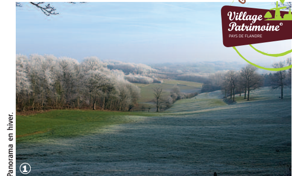
Panorama en hiver.