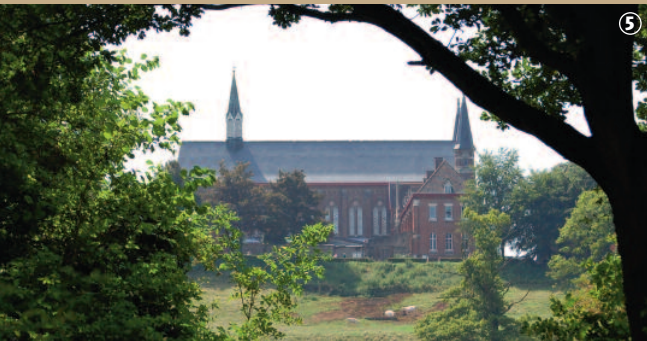
Abbaye Sainte-Marie du Mont.