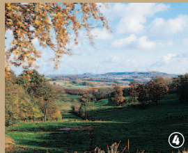
Depuis le Mont des Cats.

La région arbore fièrement cinq monts, Cassel, Noir, des Récollets, des Cats et de Boeschèpe, dont les noms résonnent comme des résistants au plat pays. Depuis l'époque tertiaire, ils ont lutté contre l'érosion grâce à leur calotte protectrice faite de grès ferrugineux. Le Mont des Cats tire son nom des Katts, population germanique occupant la région au V e siècle : il est habité par une communauté de moines trappistes.