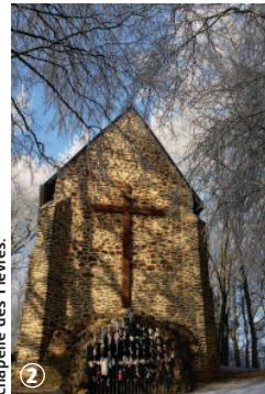
Chapelle des Fièvres.