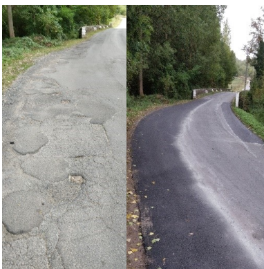
Rénovation complète du Chemin de Picot ( Ardenelles)