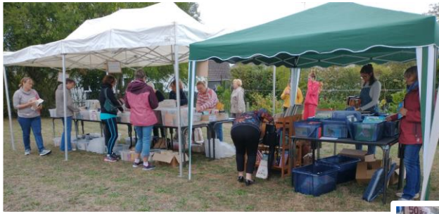
Vente de livres, troc aux plantes