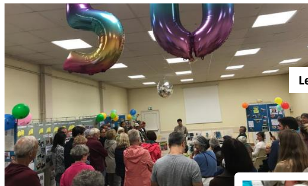
Le public fidèle

Toute la journée, la bibliothèque a convié tous les habitants à fêter avec elle ses 50 années de lecture, d'animations, de bénévolat. Vous avez été nombreux à y participer, pour la plus grande joie de l'équipe qui a su si bien partager cet événement et retracer ce beau parcours. Merci !