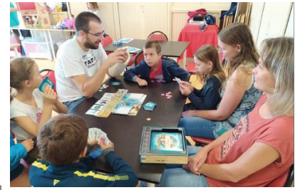
Jeux à la Ludothèque