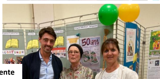
Nos élus avec notre incomparable présidente

Toute la journée, la bibliothèque a convié tous les habitants à fêter avec elle ses 50 années de lecture, d'animations, de bénévolat. Vous avez été nombreux à y participer, pour la plus grande joie de l'équipe qui a su si bien partager cet événement et retracer ce beau parcours. Merci !