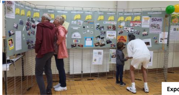
Exposition des 50 ans