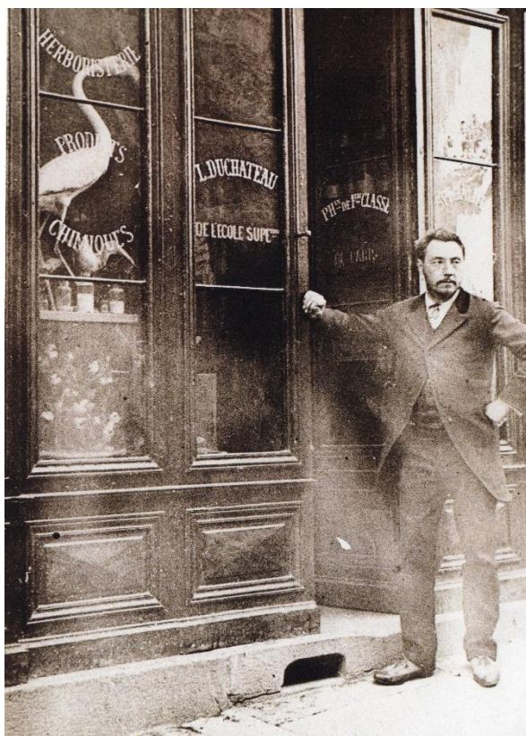
Association Notre Terroir - Musée René Baubérot