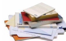
Cahiers et autres papiers