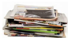
Journaux, magazines, prospectus