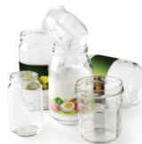
Pots et bocaux