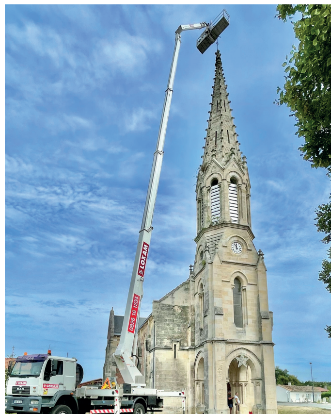
PARAFOUDRE DE L'ÉGLISE