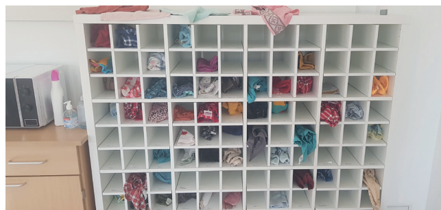
MEUBLE À SERVIETTES À L'ÉCOLE : DÉMARCHE ÉCO-RESPONSABLE