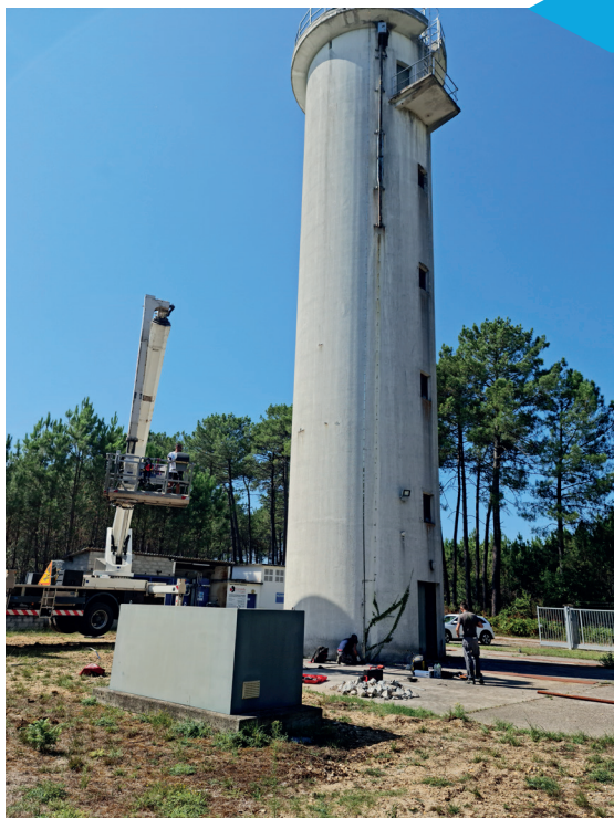
PARAFOUDRE STATION DE POMPAGE