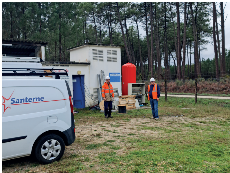
RÉNOVATION DU TABLEAU ÉLECTRIQUE DE LA STATION DE POMPAGE