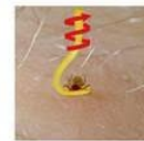
Tique - deuxième étape