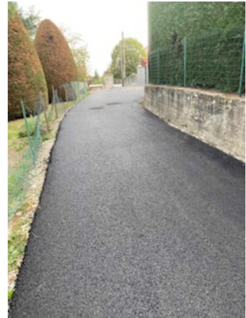
Finalisation de l'antenne de Montbrison