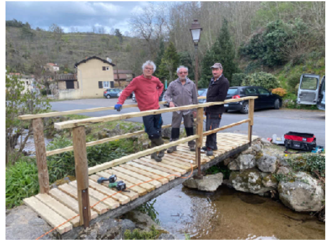
Les Amis du Vieil Ecotay