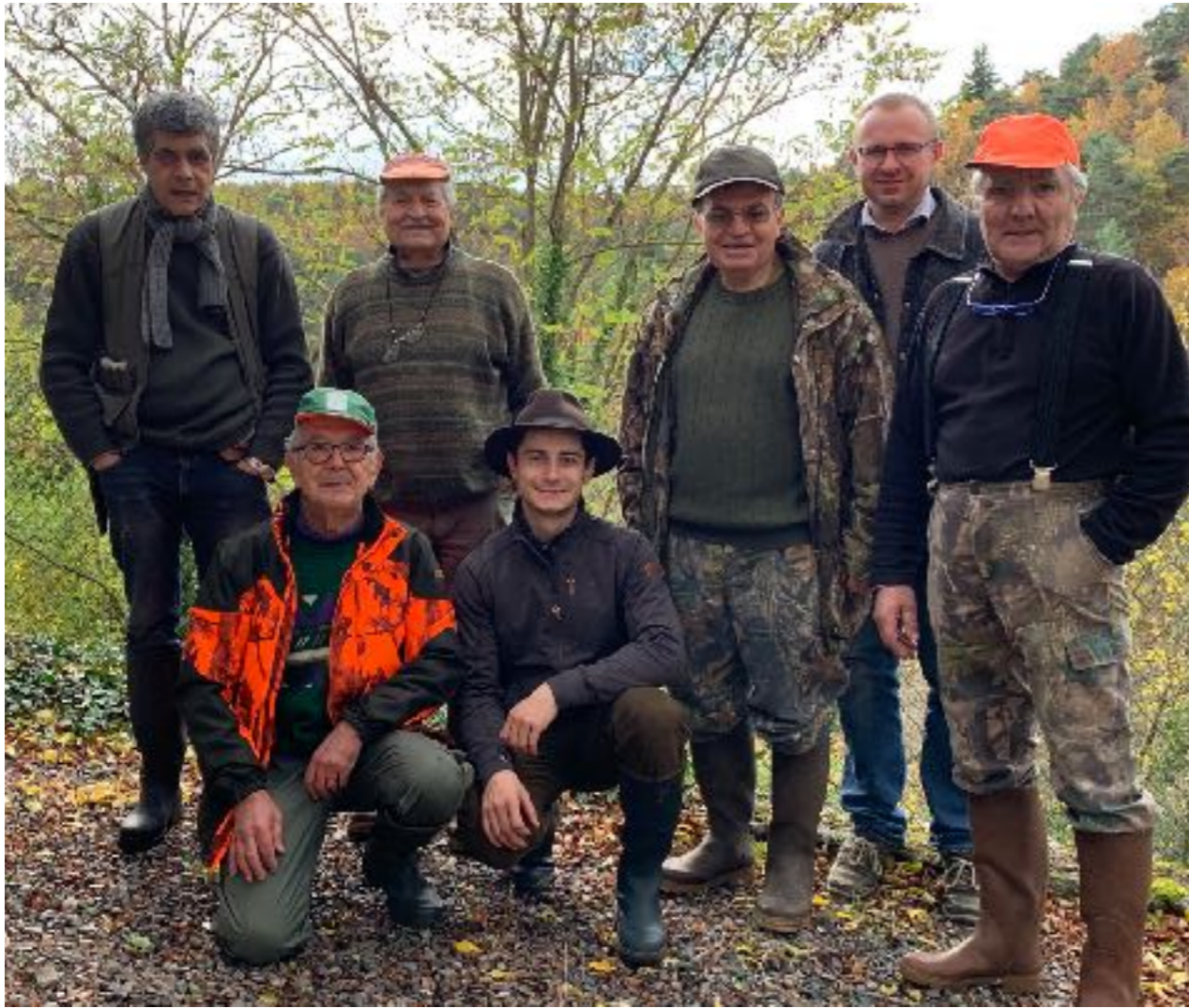
Société de Chasse