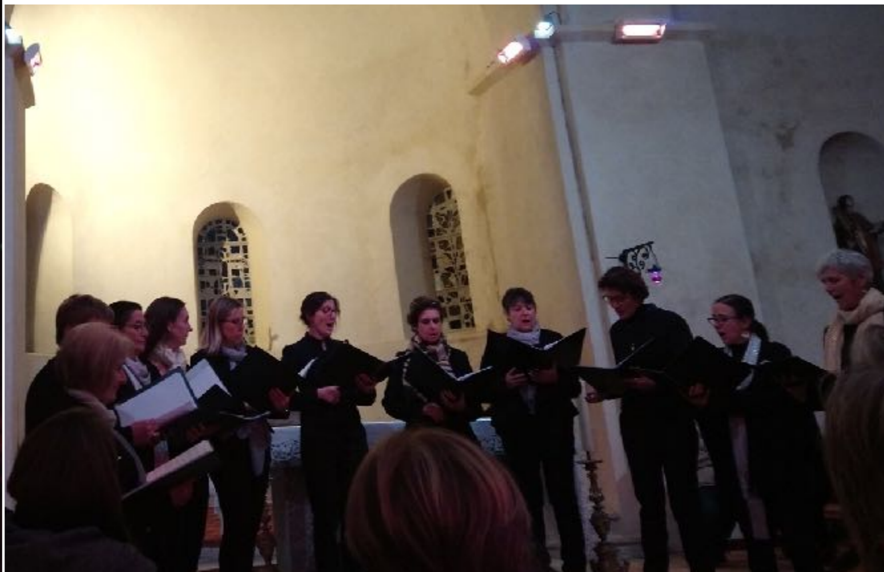
Concert de Noël