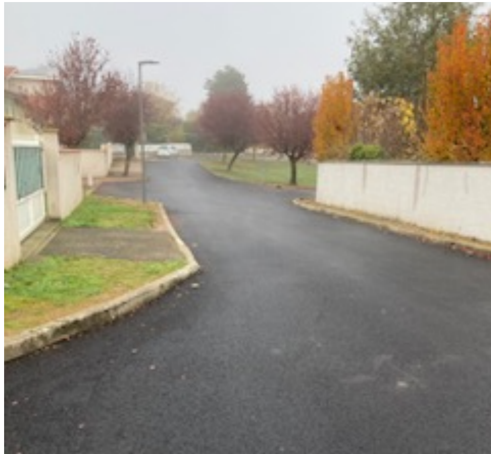
Voirie du lotissement Drouot