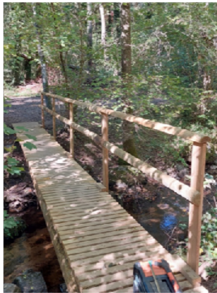
Changement de la passerelle du Père Michel