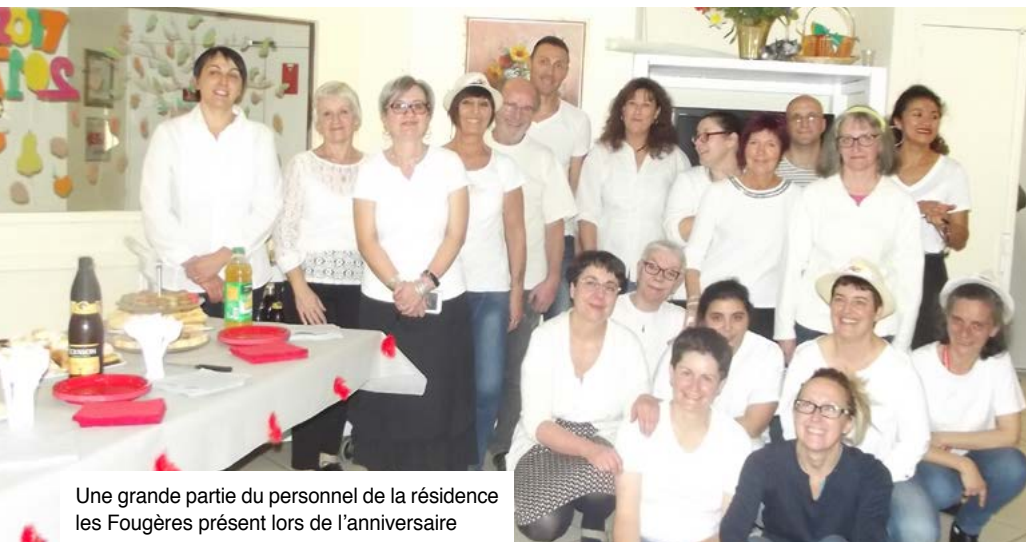
Une grande partie du personnel de la résidence les Fougères présent lors de l'anniversaire

La résidence les Fougères était à la fête le 17 Novembre dernier pour fêter ses 20 ans ! Résidents, familles, membres du personnel, élus, il y avait du monde pour souffler toutes ces bougies autour d'animations diverses qui ont satisfait petits et grands !