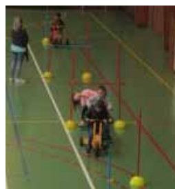
Parcours de vélo

Les parents d'élèves ont eu la possibilité de venir à l'école pour observer le travail effectué en classe. Ils ont également participé à quatre ateliers sur le thème des activités physiques.