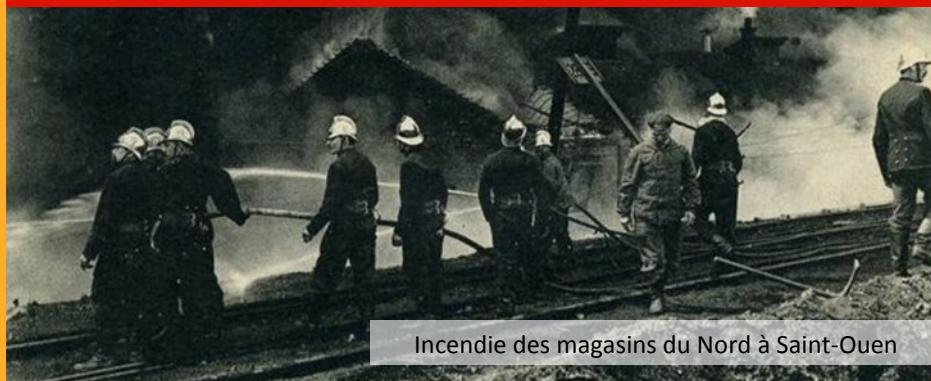
Incendie des magasins du Nord à Saint-Ouen