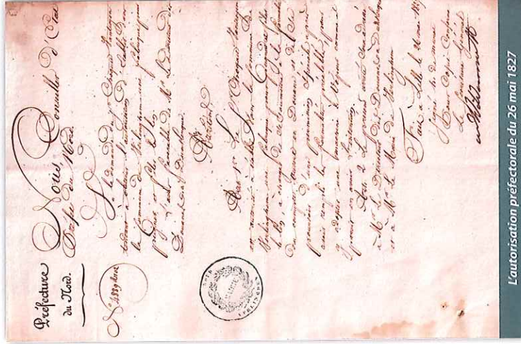
L'autorisation préfectorale du 26 mai 1827

culièrement pour l'industrie textile. D'ailleurs, cette dégradation semble affecter la filature Choquet-Vantroyen dans la mesure où sa production est réduite à 40 tonnes dès 1833. De plus, l'établissement semble avoir perdu quelques marchés puisque les fils de lin ne sont plus écoulés qu'en France. Cette situation a un impact sur le nombre de métiers utilisés (50) et sur le personnel employé (100).