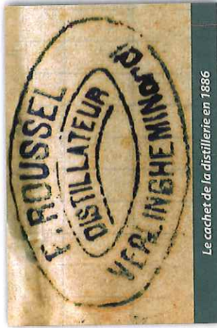
Le cachet de la distillerie en 1886

sement emploie 30 personnes (22 adultes et 8 « jeunes gens ») et, dans la mesure où l'activité d'une distillerie ne peut être interrompue, le travail s'y déroule de jour et de nuit.