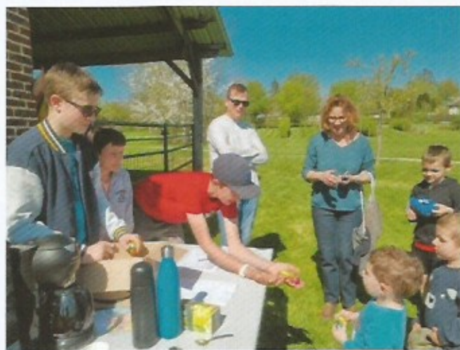
Chasse aux œufs