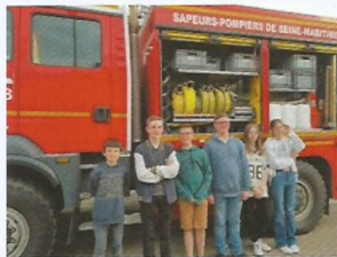
Visite de la caserne des Pompiers de Servaville

Ils participent également aux événements de la commune, ils sont présents aux commémorations ayant lieu à Grainville, aident à la distribution des colis de Noël et participent aux événements festifs (concert, vœux du maire, fête du centre village).