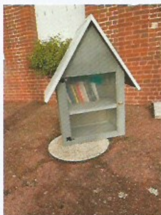
Boîte aux livres