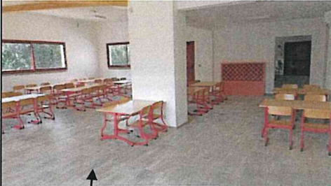
Salle de restauration élémentaire

Ce moment convivial a permis des échanges de points de vue très chaleureux entre nationalités et cultures différentes.