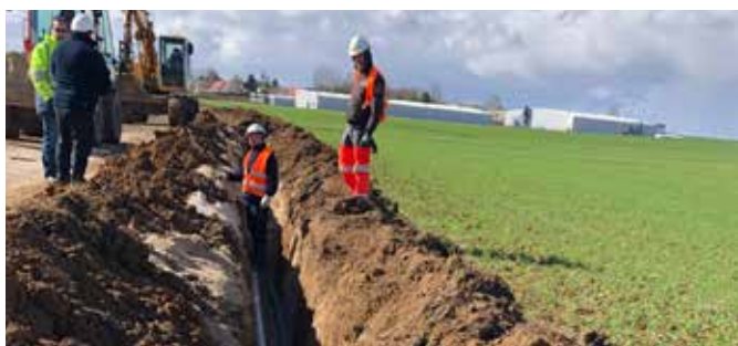
Renforcement du réseau d'eau potable à Echelles et enfouissement de la fibre optique : février à juin