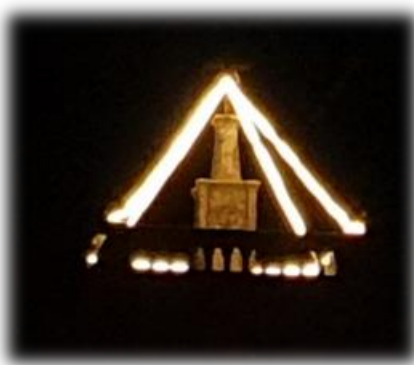
Illumination du clocher