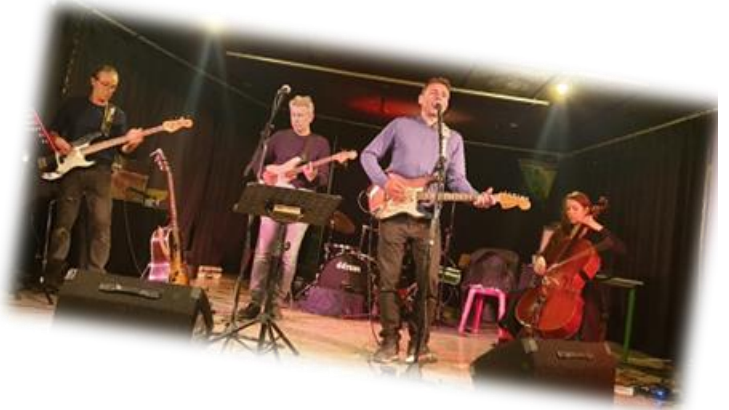
Concert hommage à Bashung