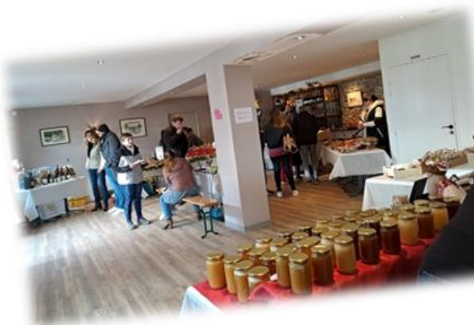
Marché de Noël au Champ de Mars