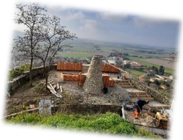
Chantier du Chastelas