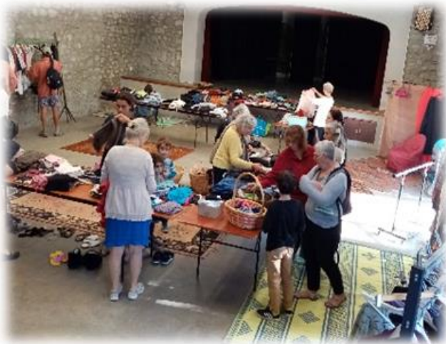
Donn'Fringues & Donn'Jouets