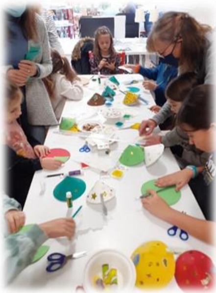
Atelier de Noël à la Médiathèque