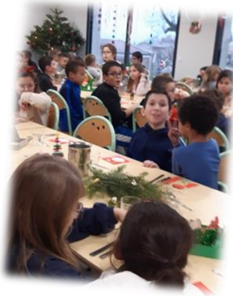
Repas des écoles