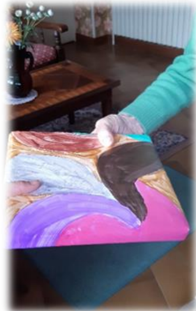
Cadeau de Noël aux anciens