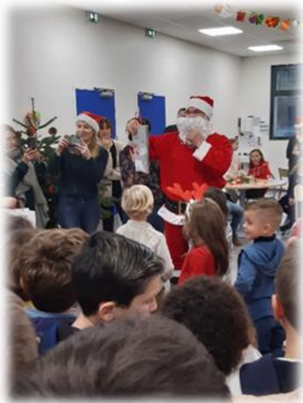
fête Noël à l'école