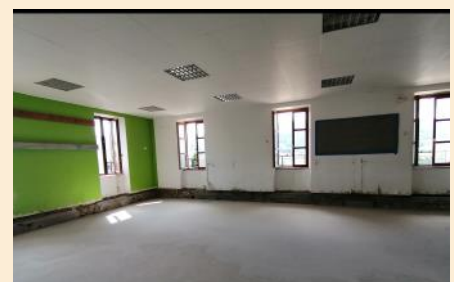
Salle de classe