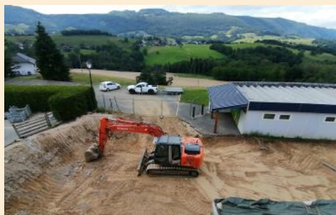
Extension du bâtiment