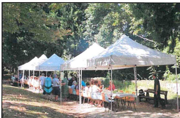
25 août : Retour du barbecue dans le parc de la mairie, suivi d'un concours de pétanque

24 octobre : Atelier cirque, animée par Babass ! Agréable moment d'échanges parents/enfants.