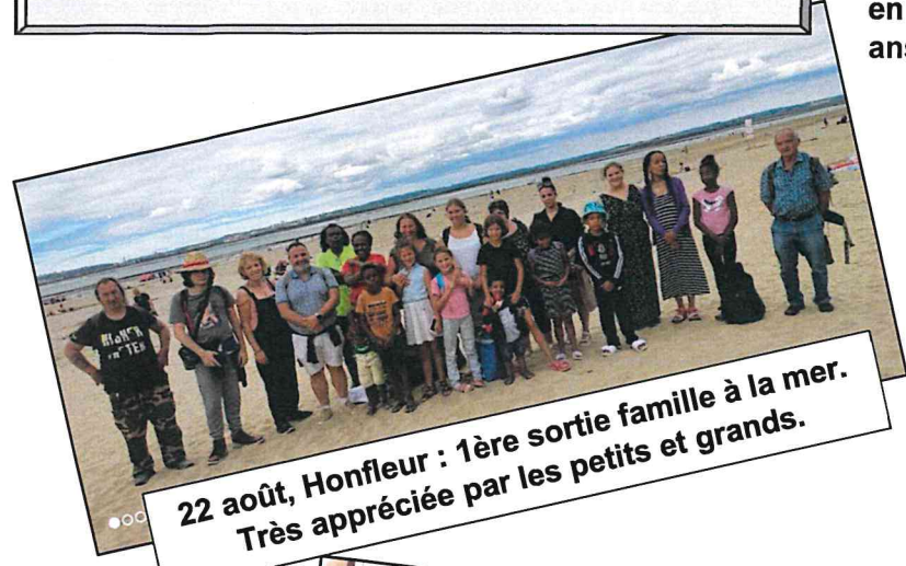
22 août, Honfleur : 1ère sortie famille à la mer. Très appréciée par les petits et grands.

* Si vous souhaitez participer aux prochaines manifestations du CCAS, vous devez vous inscrire en mairie : à partir de 70 ans pour les couples et 65 ans pour les personnes seules.