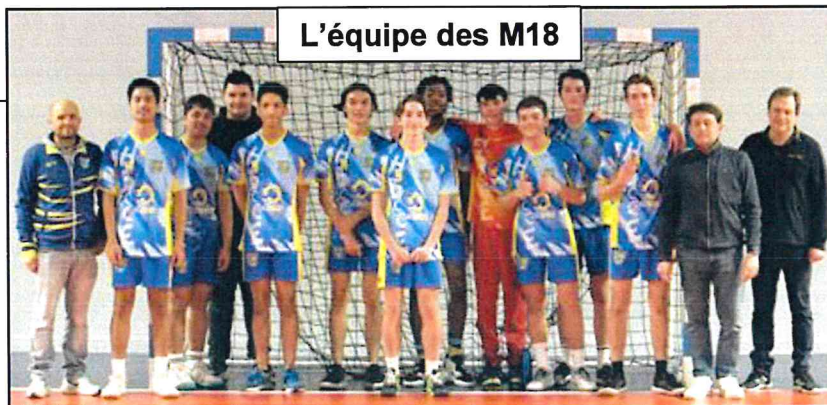
L'équipe des M18

Venez encourager nos équipes au gymnase lors des matchs à domicile les dimanches après-midi ou à nous contacter (par mail : hbcce77130@gmail.com ou par téléphone : 06.27.26.14.25) si vous voulez rejoindre un club convivial et familial, dans lequel le plaisir des enfants est primordial !