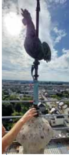
Voici les vues spectaculaires sur la commune que l'on peut découvrir du sommet de l'édifice.