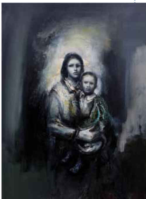
Pascal Laloy Septembre 2022 Huile sur toile 130x97cm

Comme lors des éditions précédentes, les bénévoles de l'association Que Passo ? ont assuré la partie logistique, et proposé autour de la buvette un espace agréable et convivial. Un stand de restauration a permis à chacun de manger sur place et de profiter pleinement de ces deux journées, le comité d'animation nous ayant aimablement prêté tables et bancs pour accueillir les visiteurs.