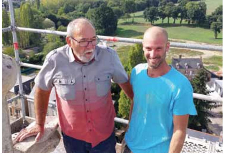
En cherchant bien, si vous habitez dans le bourg, vous devriez retrouver votre maison !