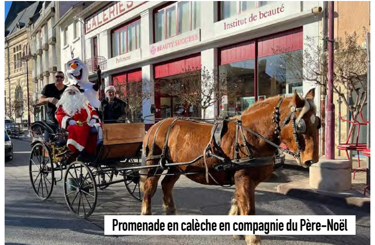
Promenade en calèche en compagnie du Père-Noël