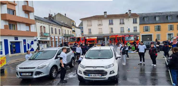
Les pompiers de la ville mobilisés : nettoyage de véhicules, exposition d'engins, atelier photo, secourisme et souvenirs , samedi 3 décembre 2022

AFMTELETHON INNOVER POUR GUERIR 2ET3 DECEMBRE 2022