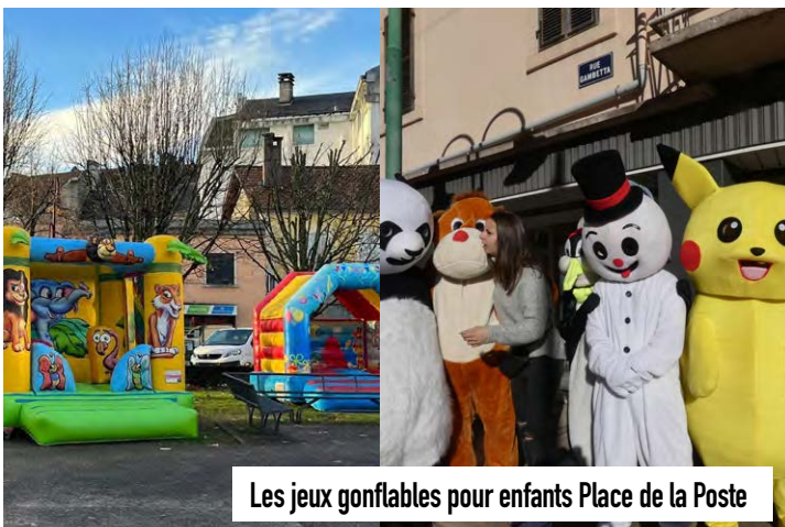
Les jeux gonflables pour enfants Place de la Poste