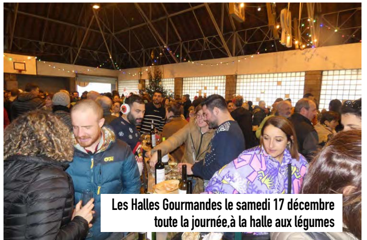
Les Halles Gourmandes le samedi 17 décembre toute la journée, à la halle aux légumes