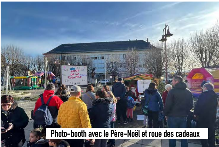
Photo-booth avec le Père-Noël et roue des cadeaux