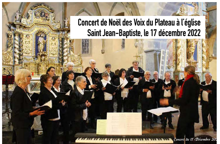
Concert de Noël des Voix du Plateau à l'église Saint Jean-Baptiste, le 17 décembre 2022