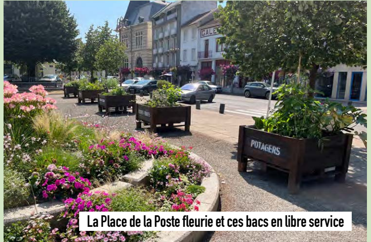
La Place de la Poste fleurie et ces bacs en libre service