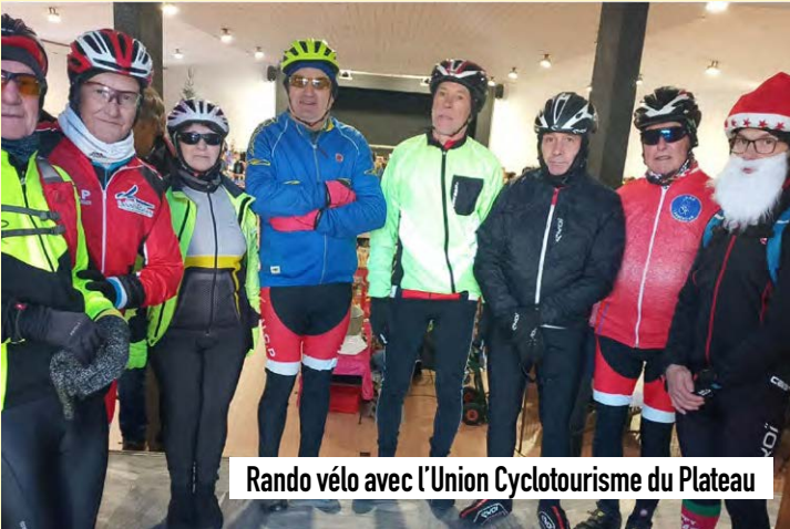
Rando vélo avec l'Union Cyclotourisme du Plateau