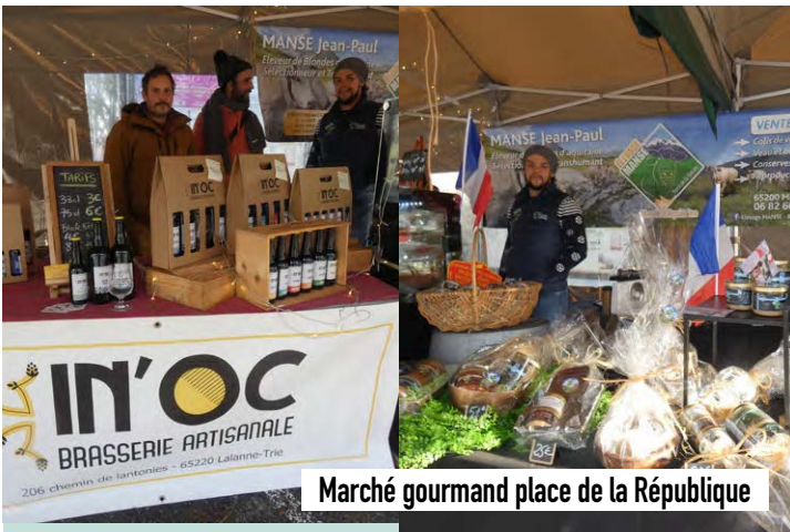
Marché gourmand place de la République