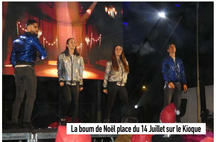
La boum de Noël place du 14 Juillet sur le Kioque