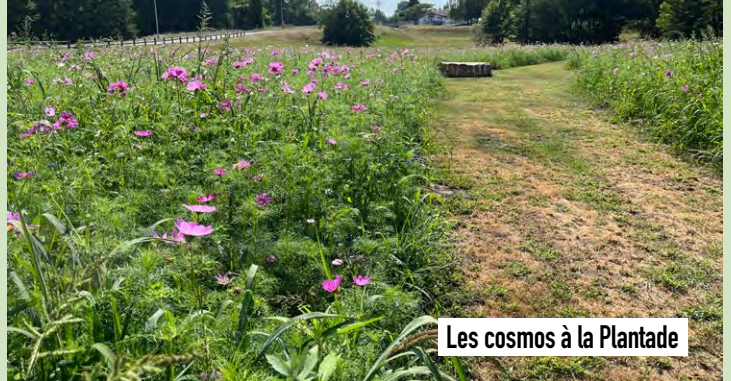
Les cosmos à la Plantade

Villes et Villages Fleuris LE LABEL NATIONAL DE LA QUALITÉ DE VIE