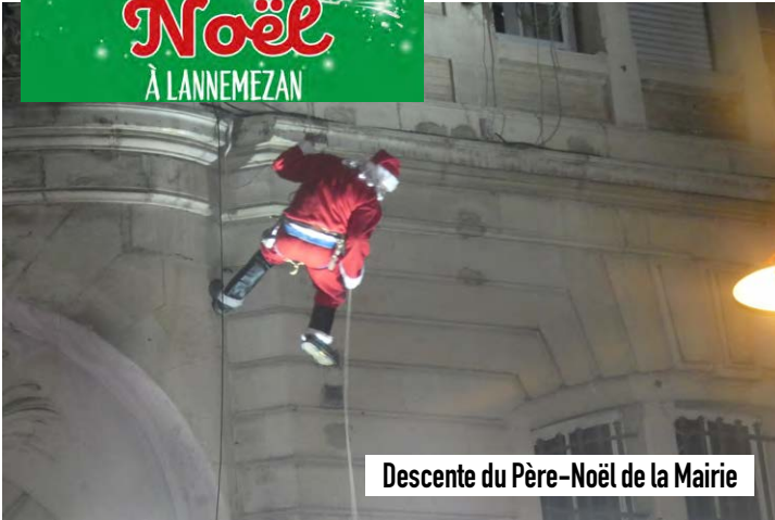
Descente du Père-Noël de la Mairie