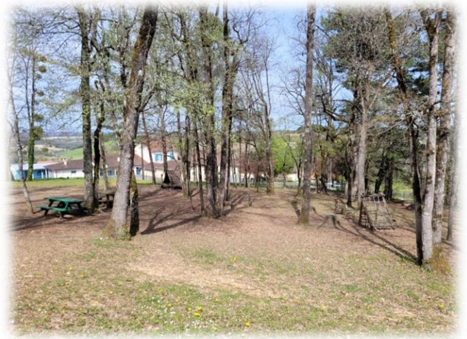
Espaces de verdure et boisés