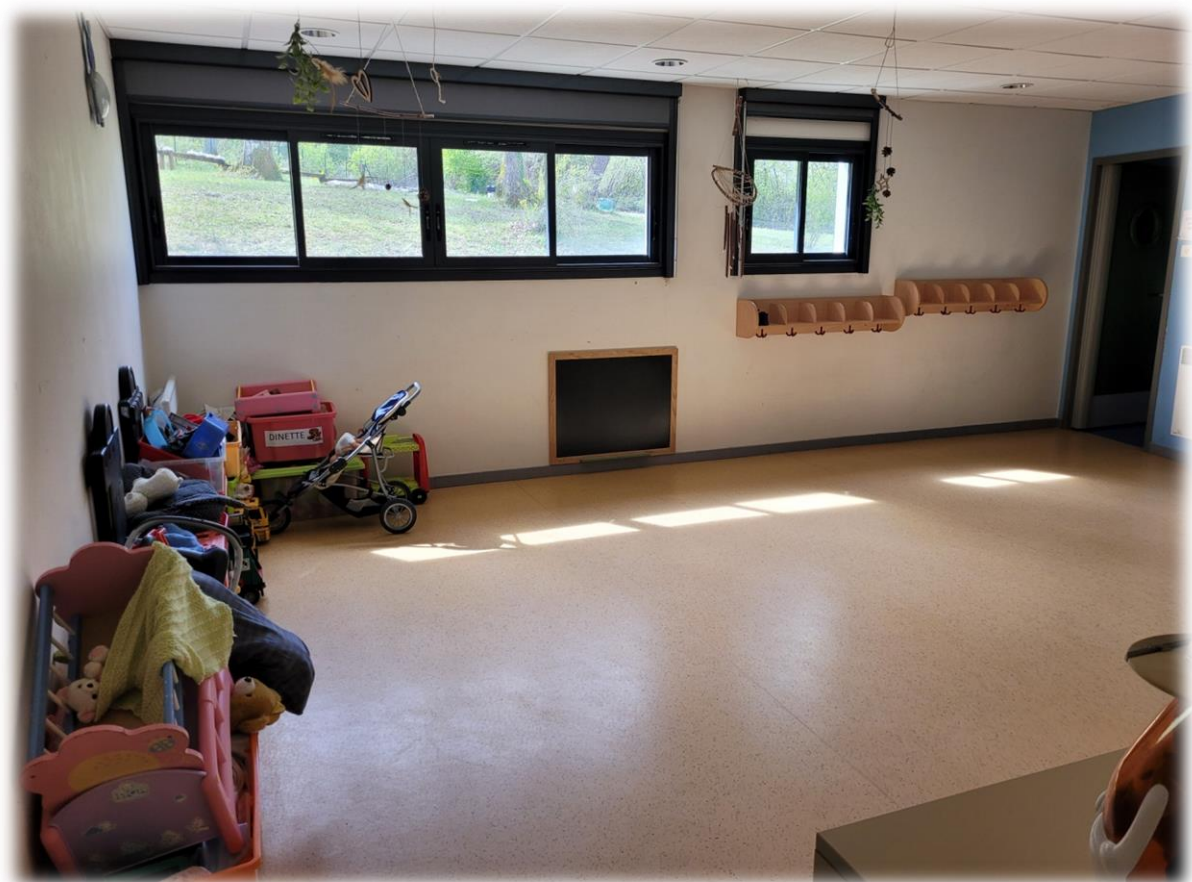
Dortoir - salle de motricité