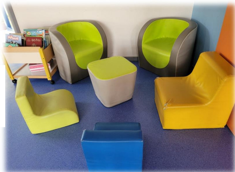
Espace de détente