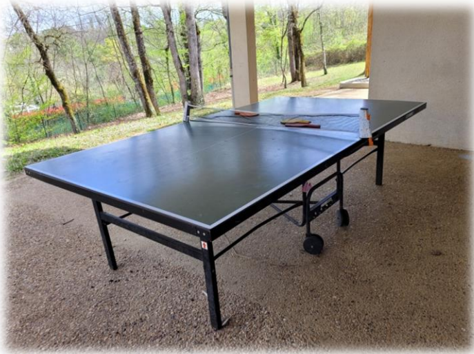
Espaces de jeux