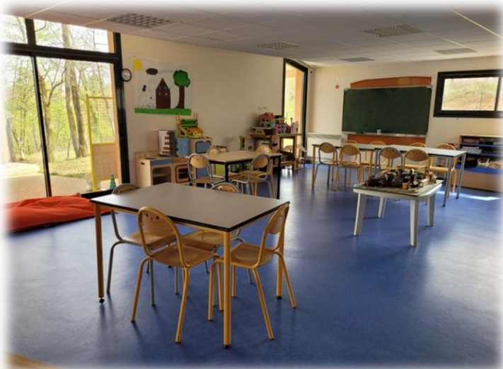
Salle d'activité 6-8 ans