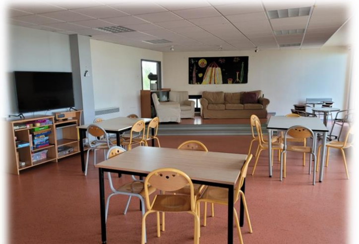
Salle d'activité 8-10 ans