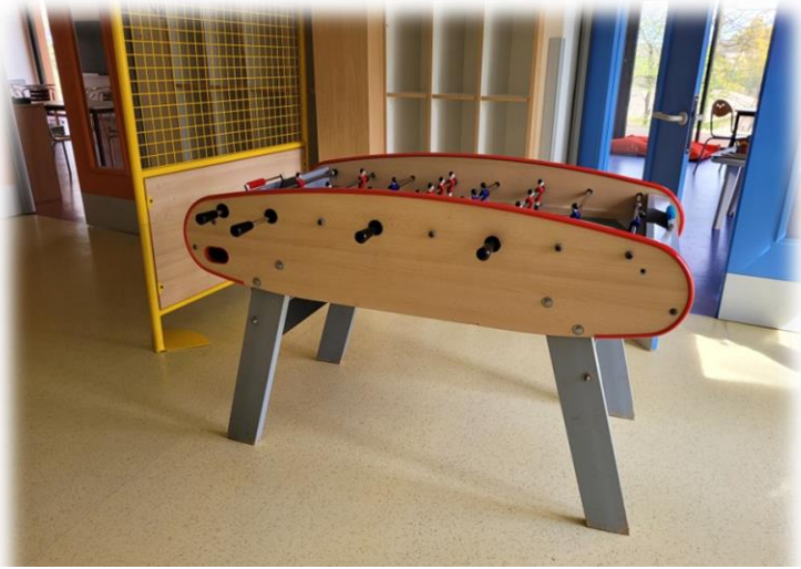
Espace de jeux