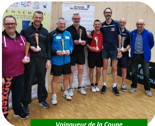
Vainqueur de la Coupe Départementale en vétérans 02 décembre 2022 Equipe de Saintines

L'ATTS adresse à toutes les Saintinoises et à tous les Saintinois ses meilleurs vœux de santé et de bonheur pour l'année 2023.