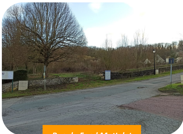
Rue du Fond Mottelet

Le dernier projet immobilier en cours concerne une bande de terrain entre le Fond Mottelet et le chemin du stade, appelé aussi "pelleuse" par les plus anciens. Plusieurs lots à bâtir sont à l'étude.