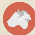
MOUCHOIRS À USAGE UNIQUE

SYMAT SYNDICAT MIXTE DE COLLECTE DES DÉCHETS COTEAUX