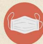
MASQUES DE PROTECTION