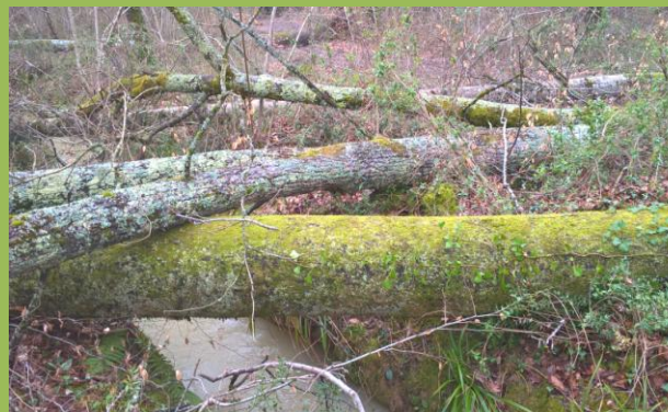
Chablis, suite au coup de vent de mars 2020

Des travaux de cloisonnement mécanique et de dégagement manuel de régénérations naturelles auront lieu en 2021 secteur « Lasgouttes »