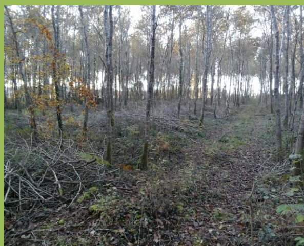
Merci aux affouagistes pour la qualité de leur travail contribuant ainsi à la régénération de la forêt

Le ruisseau de l'Ousse dessine de nombreux méandres dont deux d'entre eux se trouvent affouillés sur une grande longueur. De ce fait, la sécurité des usagers du chemin est fortement compromise. De façon provisoire, le chemin a été déplacé en novembre 2020 par la brigade verte du Syndicat Mixte Adour Amont, chargée de l'entretien des cours d'eau. Le coût de 1 300€ est supporté par ce dernier. D'autres travaux sont à l'étude pour traiter les atterrissements à l'origine de ce problème.