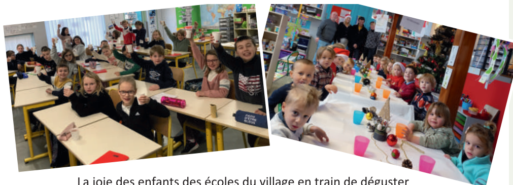
La joie des enfants des écoles du village en train de déguster le chocolat chaud et la coquille offerts par la municipalité.