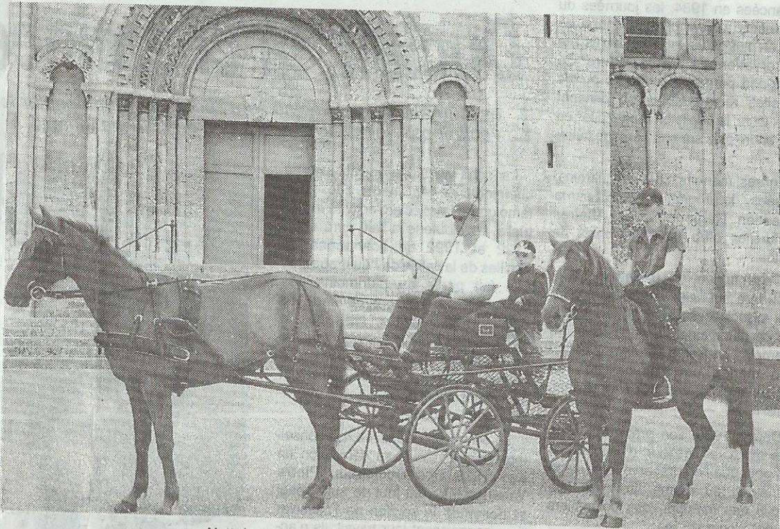
L'attelage, un excellent moyen pour découvrir la nature

Les différentes randonnées seront largement ouvertes aux licenciés des