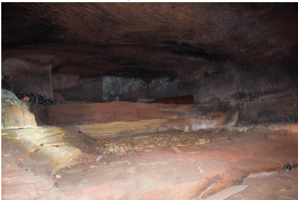
Le « Felsekeller » ou « cave des moines », un lieu chargé d'histoires.

Propos recueillis par Martine LINDAUER, complétés par Lucien LINDAUER