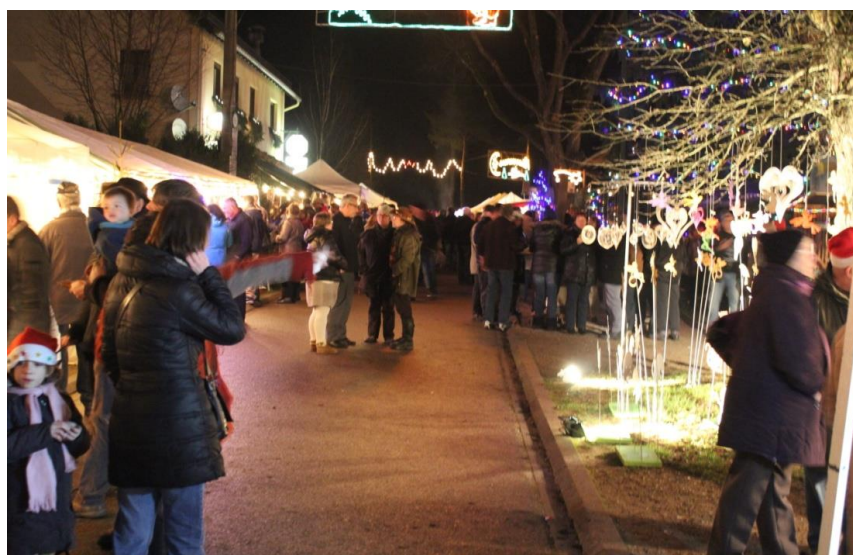
Marché de Noël de la Bremendell.