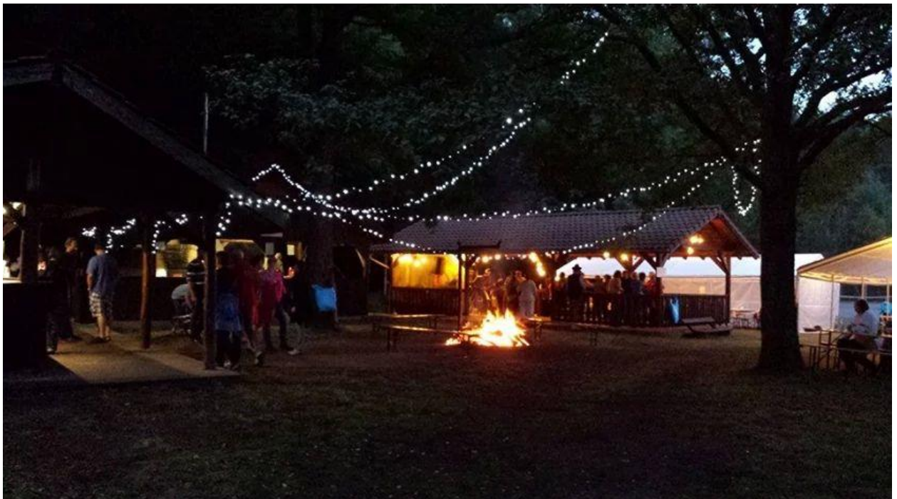
Fête d'été organisée par l'ASDAS