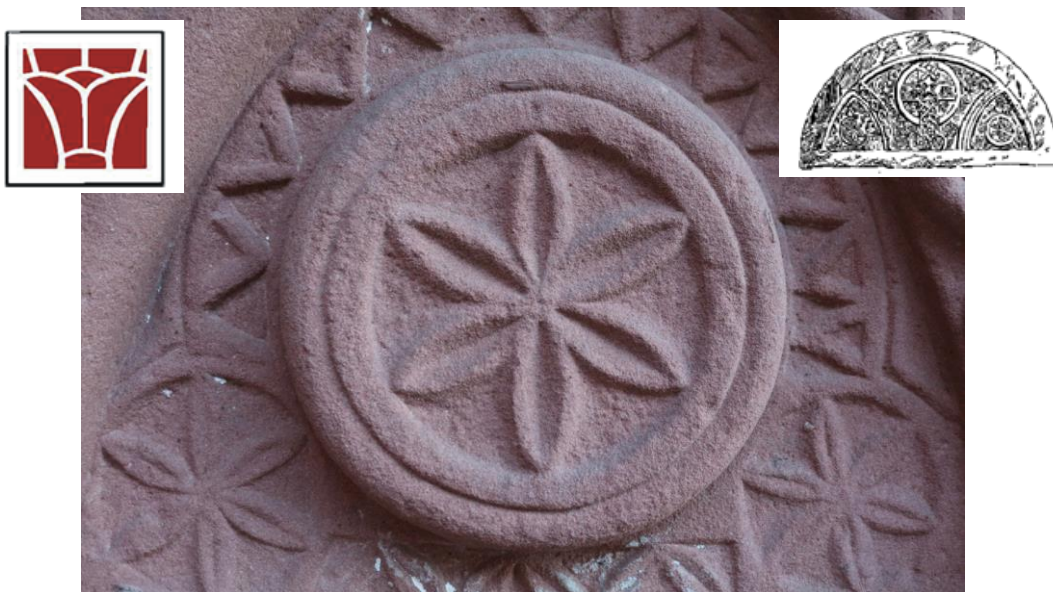
Détail d'un tympan de l'ancienne église abbatiale (logos : G. Leppert)

Contact : 10, route du Muhlenbach à Sturzelbronn – Tél. 03 87 06 20 91