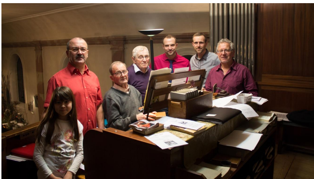
La chorale au grand complet le soir du 24 décembre 2014

Horaire des offices : tous les dimanches / 09h15