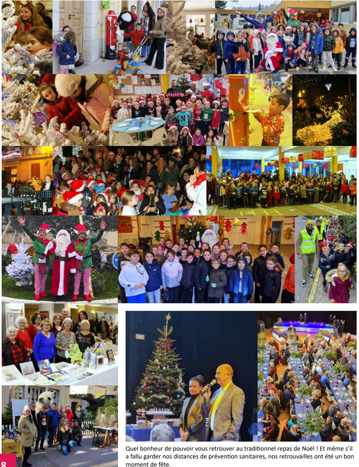
Quel bonheur de pouvoir vous retrouver au traditionnel repas de Noël ! Et même s'il a fallu garder nos distances de prévention sanitaires, nos retrouvailles ont été un bon moment de fête.