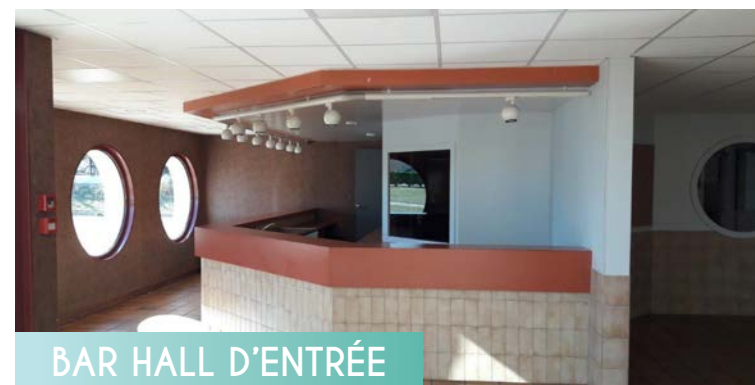
BAR HALL D'ENTRÉE