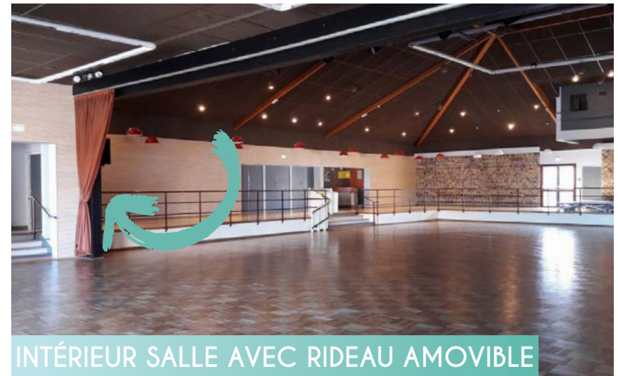
INTÉRIEUR SALLE AVEC RIDEAU AMOVIBLE