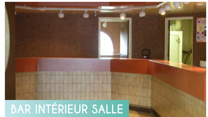
BAR INTÉRIEUR SALLE