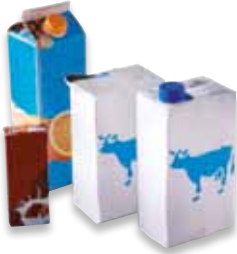
Les briques alimentaires