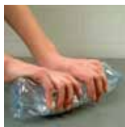
Écrasez votre bouteille débouchée à plat.

Oui. Vous réduirez ainsi leur volume et faciliteriez leur collecte et leur recyclage.