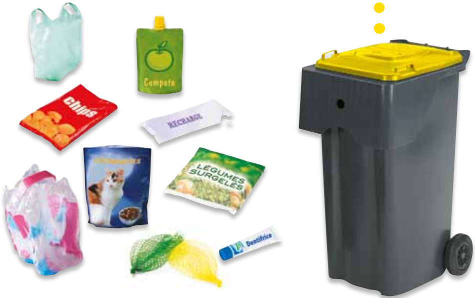
Les emballages souples

Astuce ! Ne lavez pas vos emballages, il suffit de bien les vider.