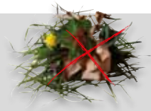
Déchets de jardinage