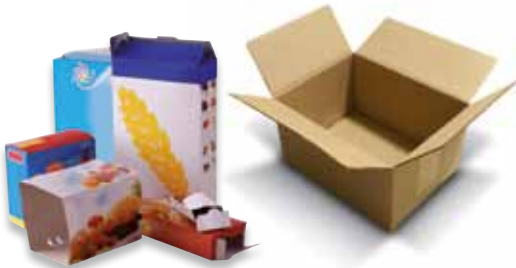
Les boîtes, sur-emballages en carton et gros cartons