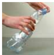
Rebouchez-la. Vous pouvez alors la déposer dans un bac jaune.