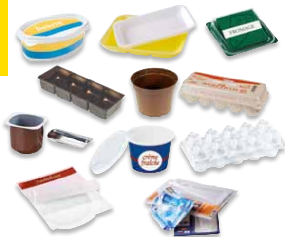
Les emballages rigides

Je les mets en vrac et vides dans le bac JAUNE