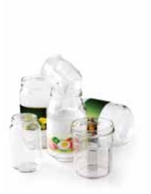
Les bocaux de conserve