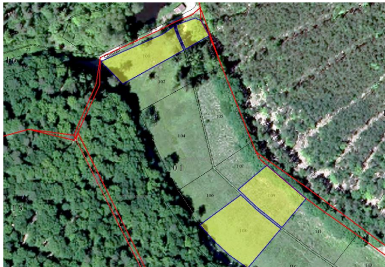
Section 1, Parc. 100, 101, 108, 109