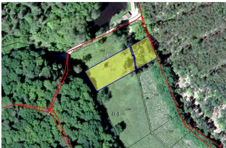
Section 1, Parc. 102, 103