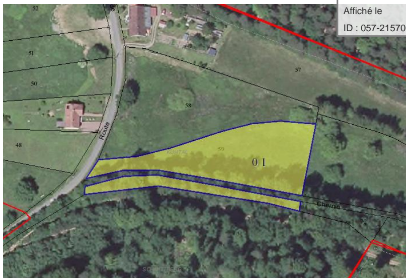
Section 1, Parc. 59, 73