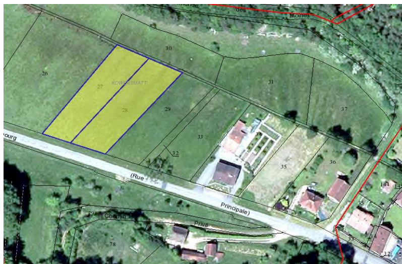
Section 1, Parc. 27, 28