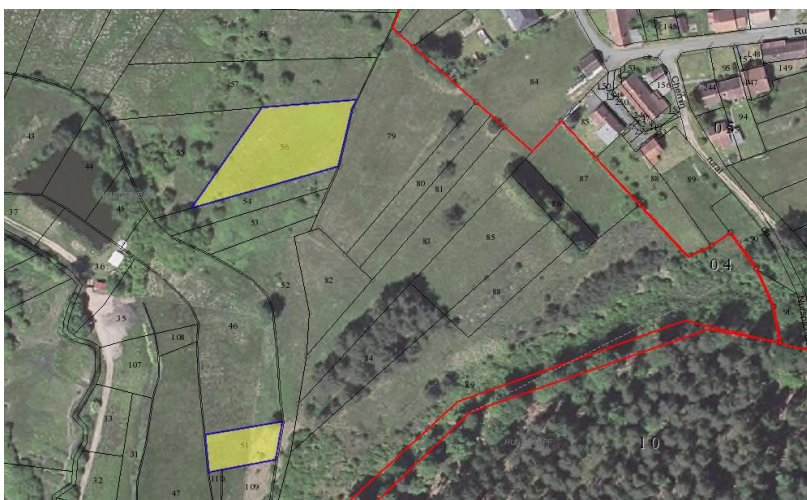
Section 4, Parc. 51, 56