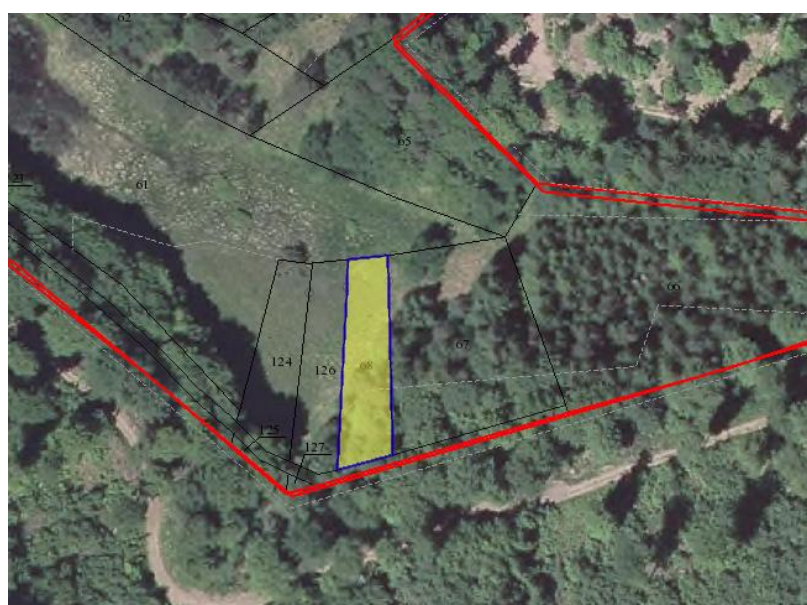
Section 1, Parc. 68