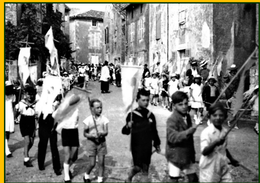
Arrivée d'une procession à l'église de Gençay (Années 1950)

Nous entendons par « Eglise »: l'édifice, le culte, le prêtre, les équipes paroissiales; et par « comportements populaires » les réponses et engagements de la population aux propositions et demandes de l'Eglise: fêtes et cérémonies, kermesses, processions, croix de missions, travaux divers... De nombreux documents, textes et photos, témoignent de ces actions communautaires.