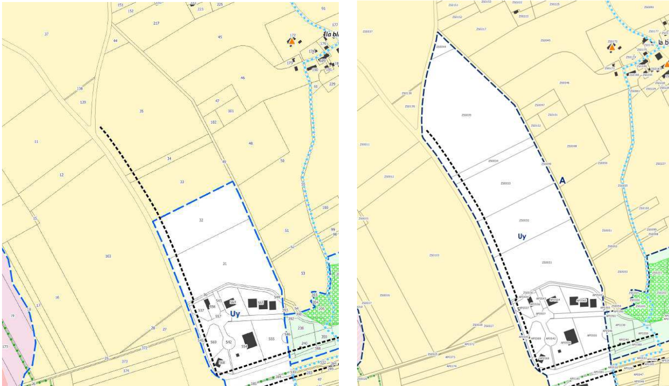
Extrait du zonage avant et après modification

Les parcelles concernées par le projet, d'une surface totale de 7,74 ha, sont situées en zone agricole « A ». La collectivité propose l'extension de la zone urbaine « Uy », dédiée aux activités artisanales et industrielles.