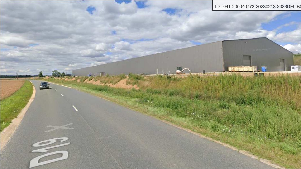
Illustration : Le bâtiment objet de la déclaration de projet, depuis la RD19