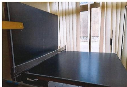
Table de ping-pong En l'état