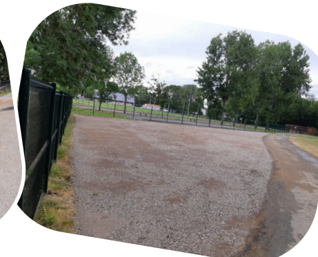
Création d'un parking au terrain de pétanque. Décaissement et engrillonnage.