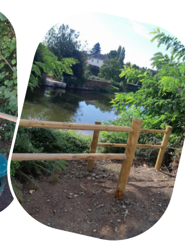
Rue du Puy sans Tour : aménagements accès au Lay, escalier et barriérage de sécurité (et mobilier en cours).