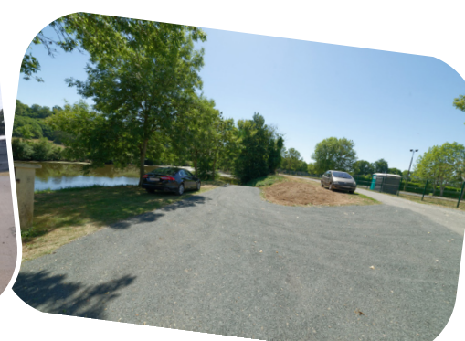
Descente à bateau : profilage de la bande enherbée pour faciliter la circulation des remorques à bateau.