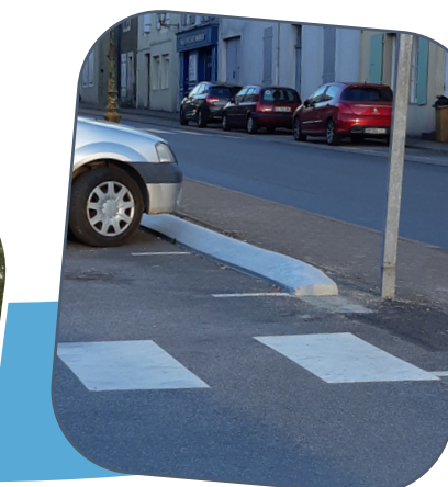
Place circulaire : installation de butée en remplacement des plots béton.