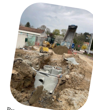
Rue su Simon : création des canalisations d'eaux pluviales, rénovation de canalisation d'assainissement