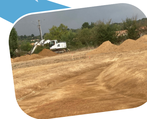
Début des travaux du futur lotissement «la Ponne des Noues»