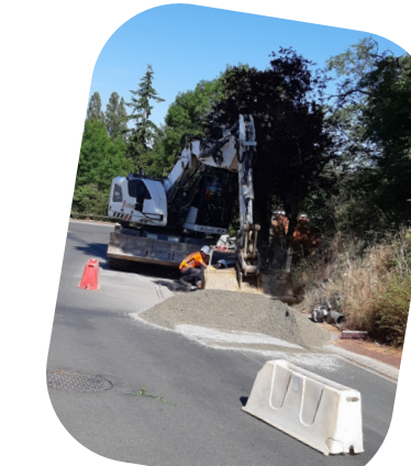
Rue de l'Ouche du Fort : remise en état de la chaussée et de l'avaloir en face du calvaire.