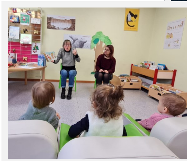
Les Bébés lecteurs