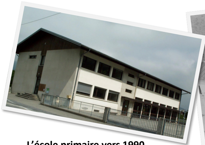
L'école primaire vers 1990