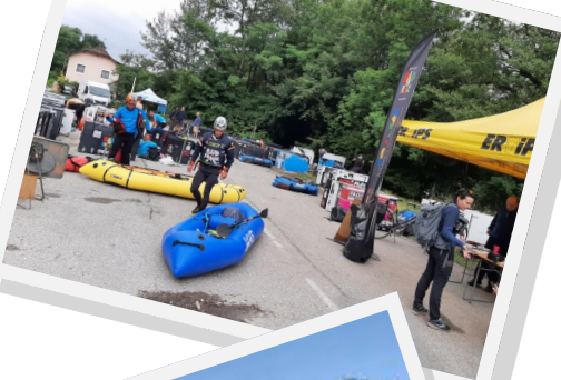
Raid In France Juin 2022