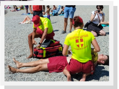
Exercice de secours à la base de loisirs 8 août 2022