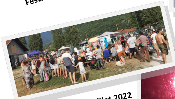
Fête du village - 9 juillet 2022