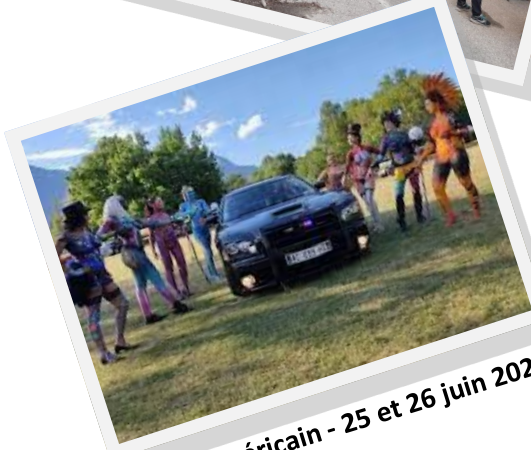
Festival américain - 25 et 26 juin 2022