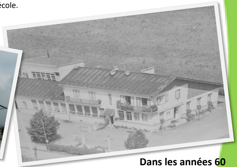
Dans les années 60