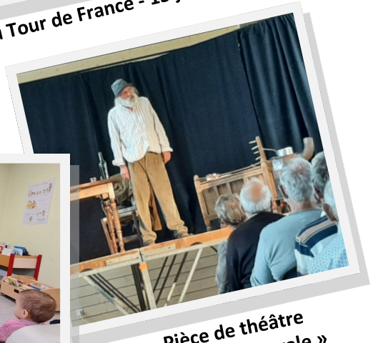
Pièce de théâtre « La Veillée Rurale »