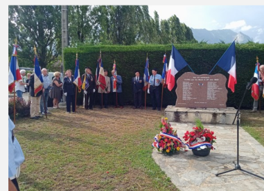
Cérémonies commémoratives du 11 novembre et du 23 juin