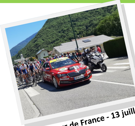
Passage du Tour de France - 13 juillet 2022