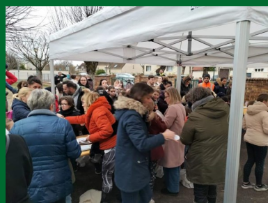
Vente de gâteaux par le CME