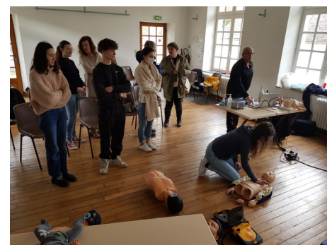
Réaliser un massage cardiaque