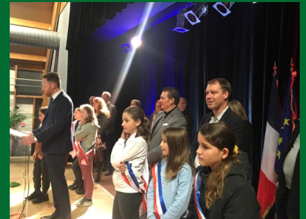
Vœux du maire avec le CME