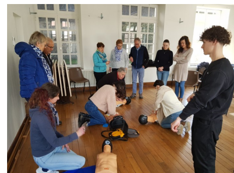
Apprendre à utiliser un défibrillateur