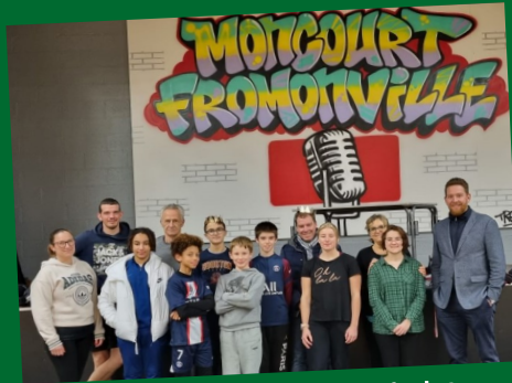
Galette des rois avec le badminton