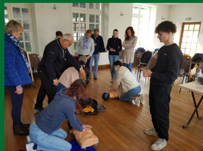
Les gestes qui sauvent