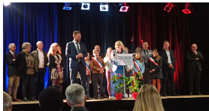
Discours de Valérie LACROUTE