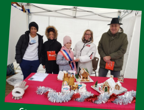
Concours de maisons en pain d'épices