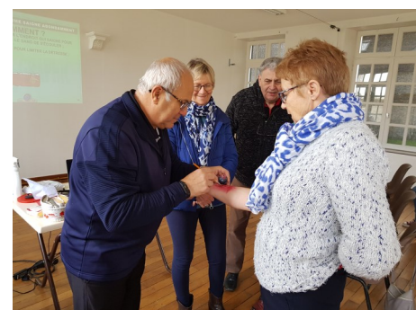
Arrêter un saignement abondant

Accidents, malaises, catastrophes.. Et vous que feriez-vous ?