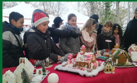
Marché de Noël avec le CME