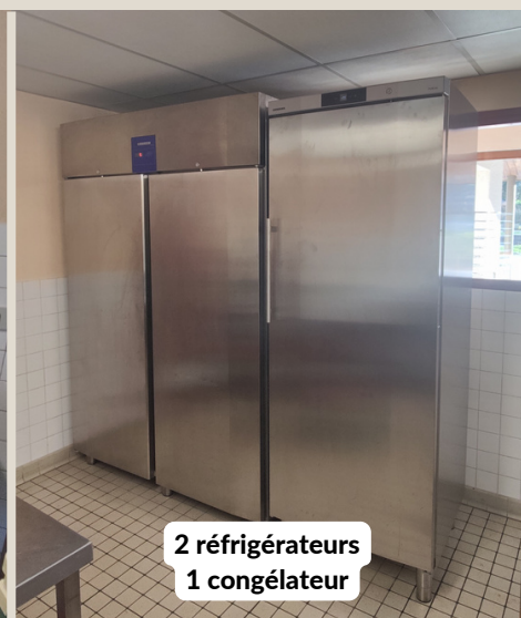
2 réfrigérateurs 1 congélateur