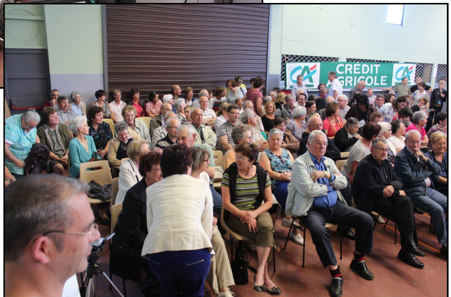
Une vue du public lors des conférences