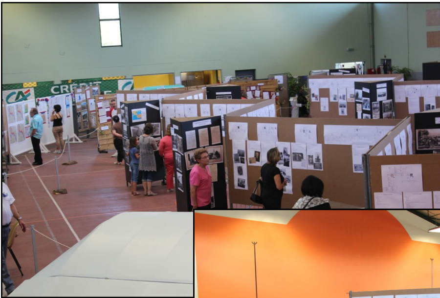
Une vue générale de la salle d'exposition