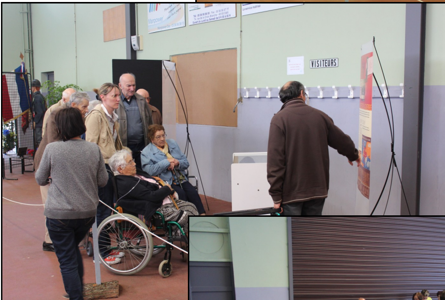
... et fils et filles de Poilus