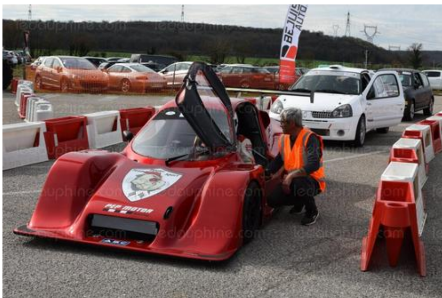
Les commissaires ont aussi un rôle de conseil auprès des coureurs.

Le quatrième week-end d'essais de la côte de Barjus à Malville s'est déroulé ces 18 et 19 mars avec tous les voyants au vert : des essais parfaits, plus de 300 repas pour le restaurant, plusieurs centaines de kg de frites à la buvette, et 4 000 visiteurs dans les deux jours.