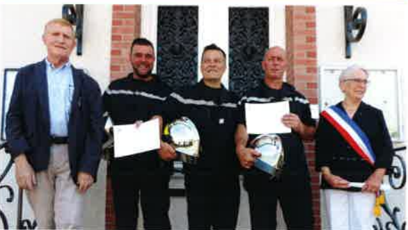
Remise de diplômes pour trois sapeurs- pompiers de Damery.