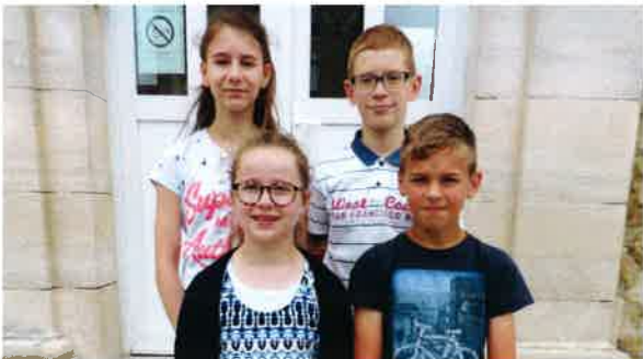
Quatre élèves à l'honneur prix Paul Douce.