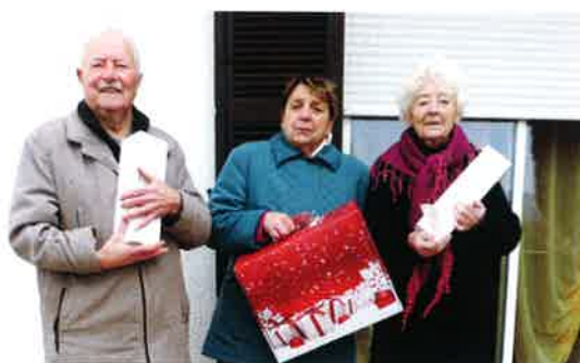
Distribution des colis des aînés.