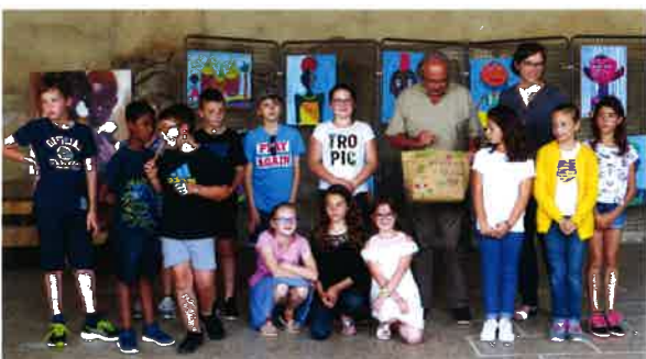
Boursault - Exposition peintures.