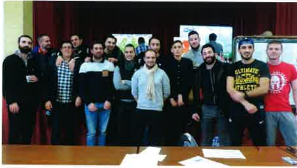
Tournoi de FIFA organisé par l'USD de Damery.