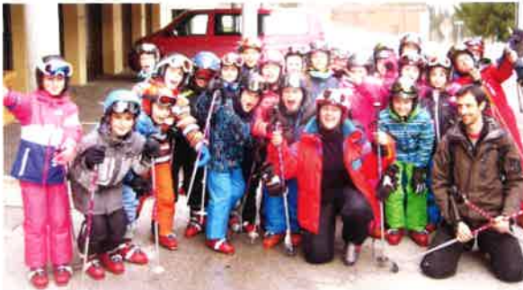
Classe de neige des élèves de CM2.