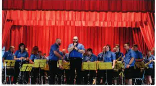
L'harmonie des Tonneliers d'Épernay en concert à Damery.