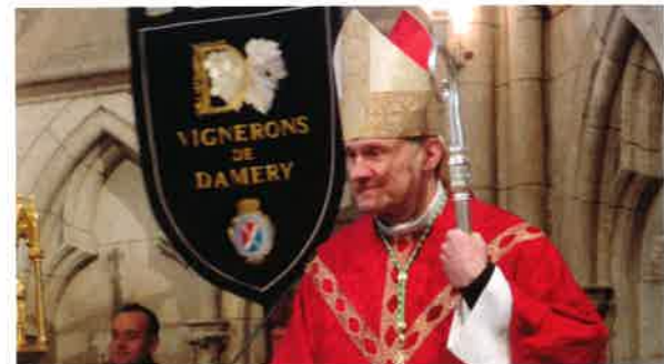
Monseigneur Trouvet, Évêque de Châlons-en-Champagne