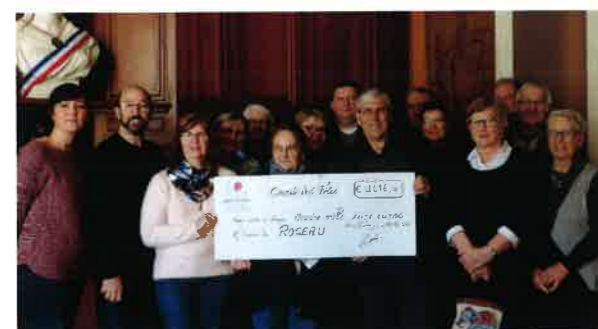
Remise du chèque de 4016 euros pour l'Association ROSEAU par le Comité des Fêtes.