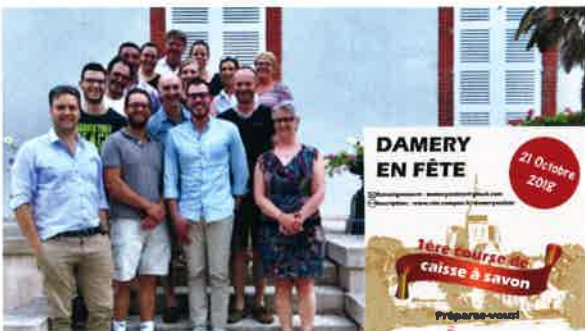
Une nouvelle association est née : Damery en fête.