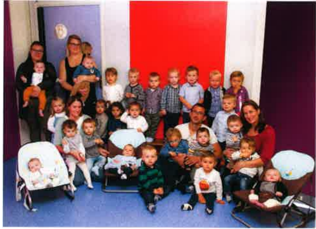
Les Petites Frimousses