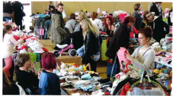
Belle affluence pour la journée broc'enfants organisée par les parents d'élèves.