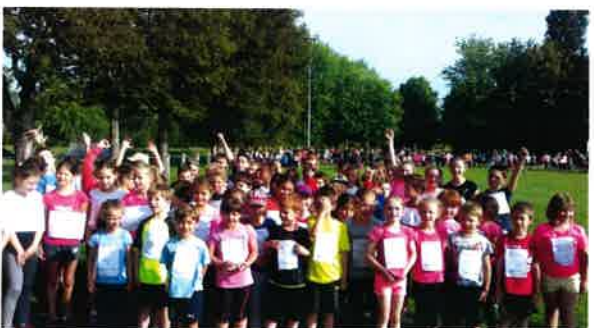
Cross des écoles 5 élèves sur le podium.