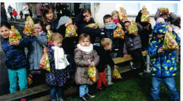
Chasse aux oeufs organisée par le Comité des Fêtes.