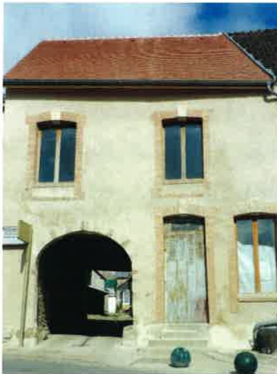
La maison Renard