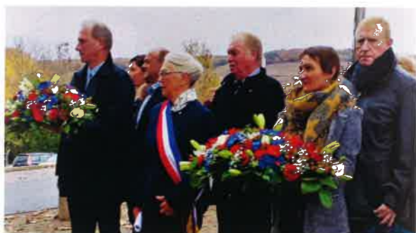
Cérémonie du 11 Novembre 2018 centenaire de la grande guerre 14-18.