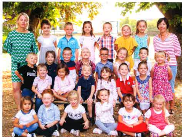
Moyenne et Grande Section