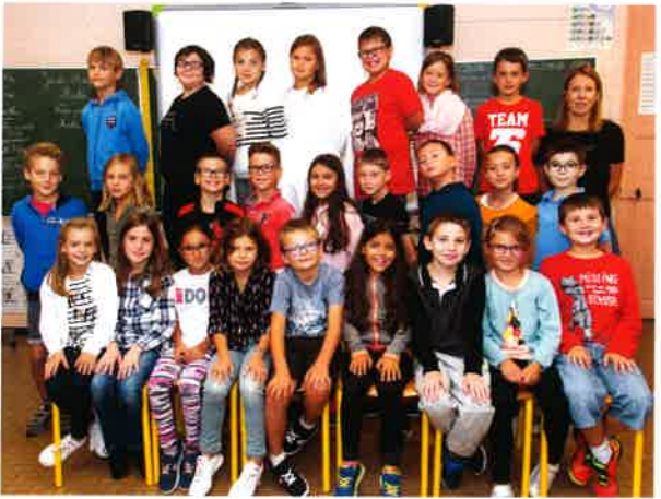
CE2 - CM1