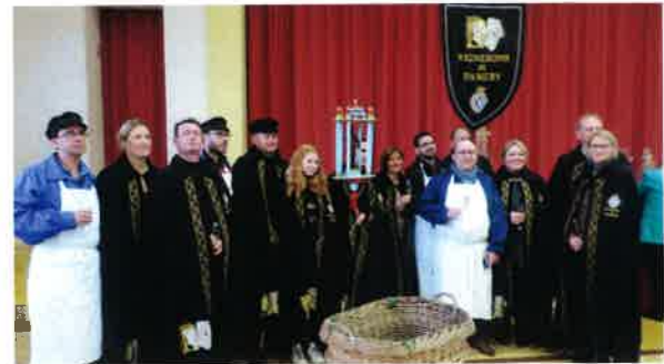
Membres de la Confrérie de Saint-Vincent.