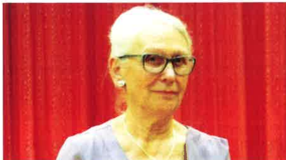
Vœux du Maire.