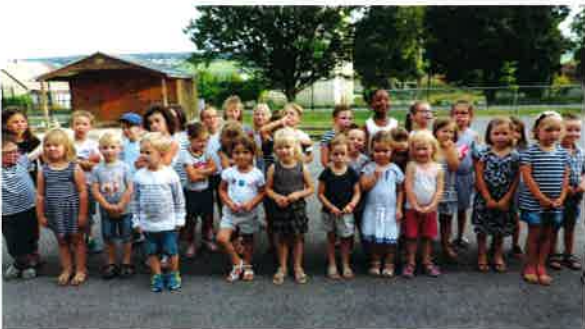
Ecole maternelle exposition les enfants chantent.