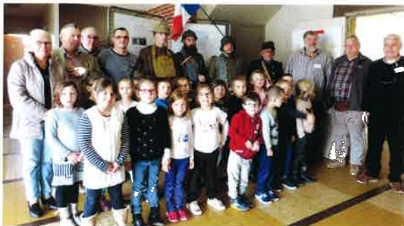
DHA reçoit les enfants des écoles pour l'exposition de la grande guerre 14-18 de Damery.