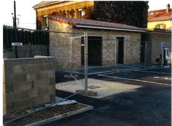
Place Ernest Lambert