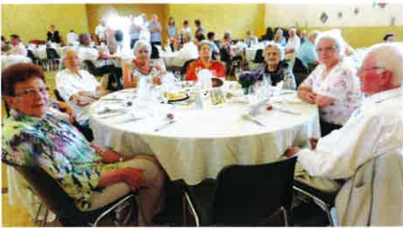
Repas des aînés.