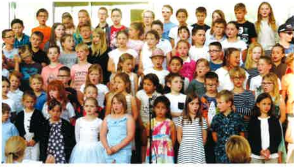
Fête de la musique organisée par la Caisse des écoles.