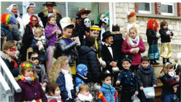
Carnaval des enfants par le Comité des Fêtes.