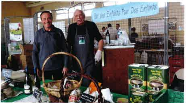
10 e Salons des vins de la gastronomie et des arts organisé par l'Union Sportive.