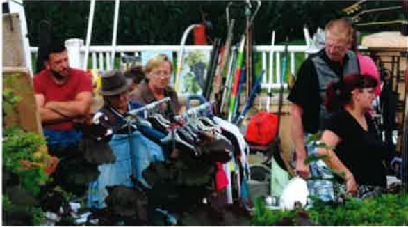
Brocante organisée par le Comité des Fêtes.