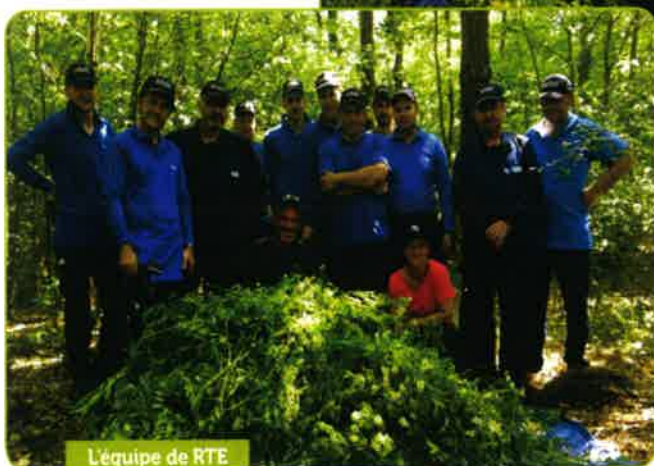
L'équipe de RTE

C'est en 2012 que, tout naturellement, les communes de Venteuil et de Damery se sont alliées au Parc naturel régional de la Montagne de Reims afin de préserver le site des Pâtis de Damery Patrimoine exceptionnel et marqueur historique de l'évolution de nos villages, les pâtis, ces anciennes pâtures à moutons, regorgent d'une faune et d'une flore remarquables que les communes se doivent de maintenir et valoriser. Nous devons sensibiliser nos habitants et les enfants de nos écoles à la prise en compte de la nature ordinaire et extraordinaire qui les entoure.