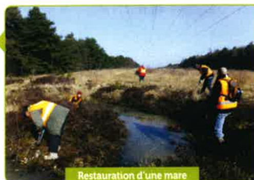
Restauration d'une mare