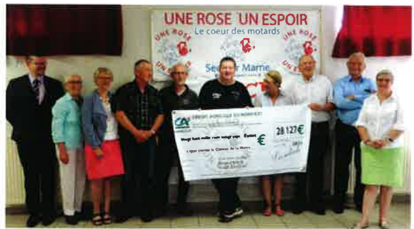
Remise du chèque Une rose un espoir de 28127 euros.