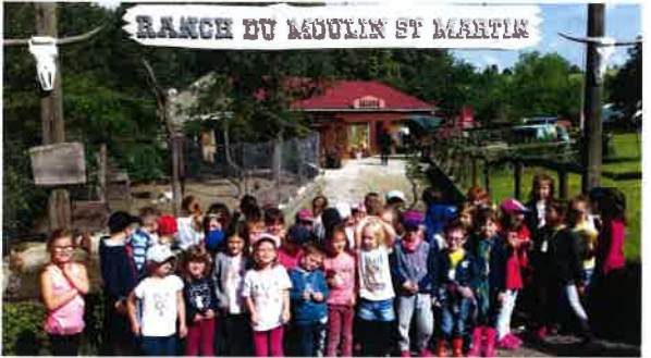
Journée découverte au Ranch de St Martin à Montmirail pour les élèves du CP et maternelle.