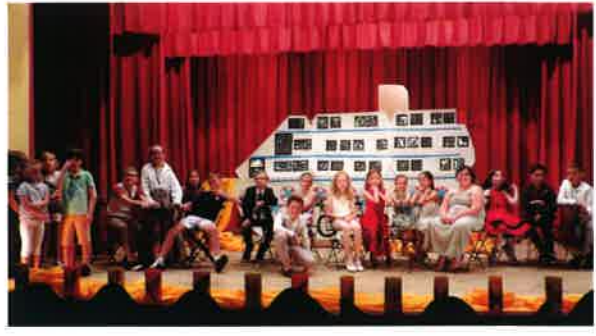
Soirée des intervenantes (NAP) pièce de théâtre (MYSTERE SUR LE NIL)