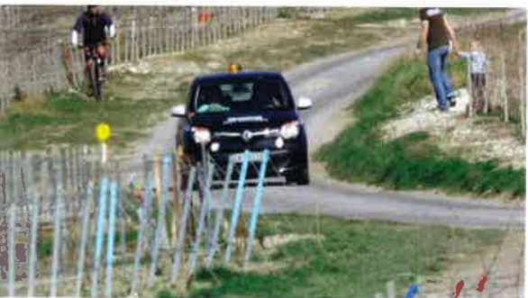
Rallye des Vins de Champagne.