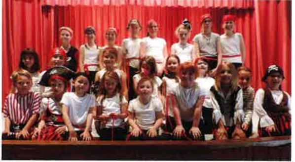
Gala de danse organisé par le B.E.V.M.