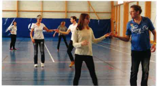
Danse latine organisé par le B.E.V.M.