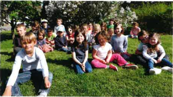
Une trentaine d'enfants au centre aéré.