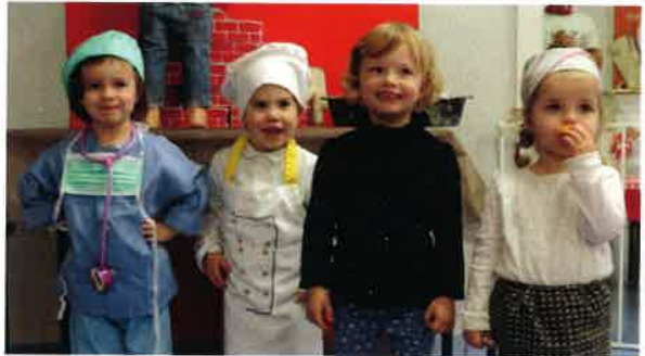
Carnaval des petites frimousses.