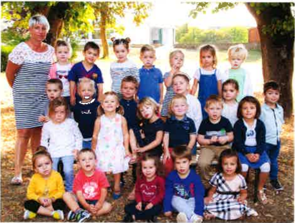
Petite et Moyenne Section