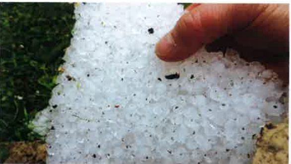
Violent orage de grêle.