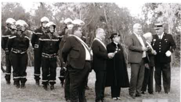
Cérémonie du 20 novembre Damery-Venteuil Fleury-la-Rivière.