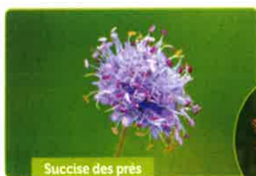
Succise des prés

La végétation des mares est ensuite coupée manuellement afin d'éviter leur comblement et d'apporter les conditions de vie idéales aux amphibiens, libellules et plantes typiques de ces milieux. Ces travaux ont été réalisés dans le cadre de chantiers nature organisés par le Parc et le CENCA. Des bénévoles extrêmement motivés ont entretenu six premières mares en février. Ensuite, l'association Reims espoir a été mandatée durant plusieurs jours cet automne, afin d'entretenir l'ensemble des mares restantes