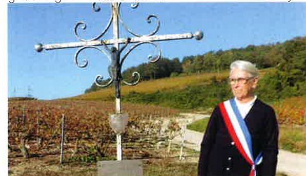
Dépôt de gerbe à la Croix des Geais en présence de la Marne.