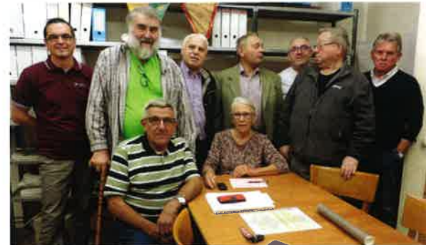
Réunion DHA préparation de l'exposition sur la grande guerre les 9-10-11 novembre à Damery.