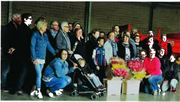
Une rose un espoir - Préparatifs de 13000 roses pour 200 motards.