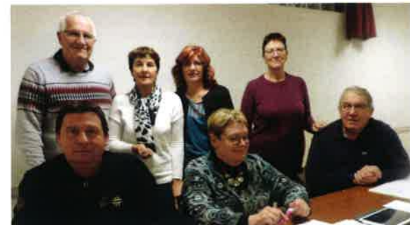
Assemblée Générale du Comité des Fêtes.