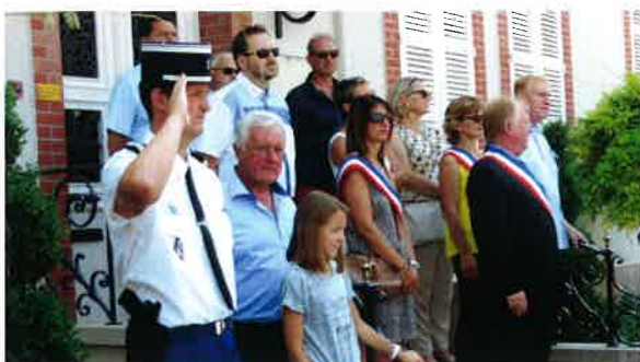
Défilé du 14 juillet.