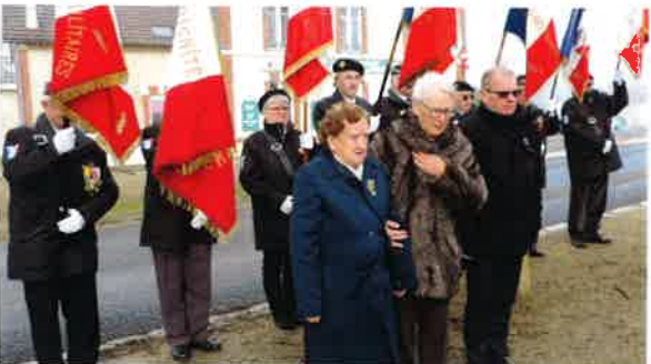
Une année mémorielles pour les anciens combattants et remise de gerbe.