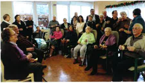
Vœux à la Résidence Le Parc.