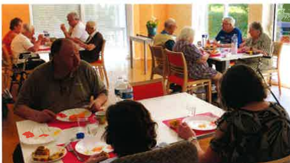
Assemblée Générale de la Résidence le Parc.