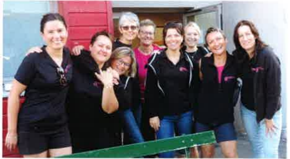
200 randonneurs, organisé par le B.E.V.M.