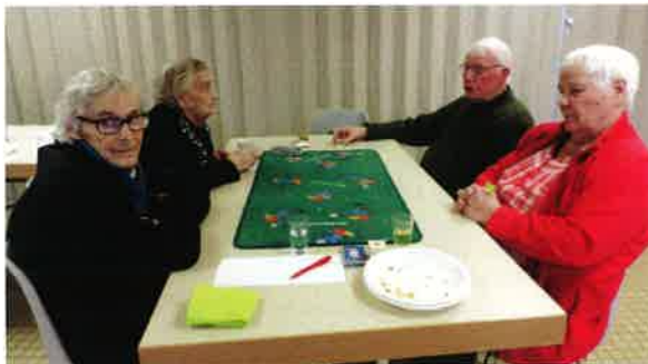
Vœux du Renouveau