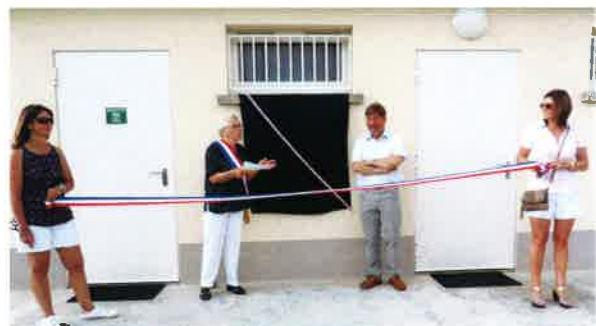
Inauguration des vestiaires foot.