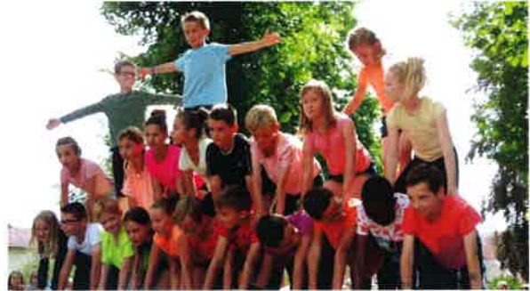
Kermesse des écoles organisée par la caisse des écoles