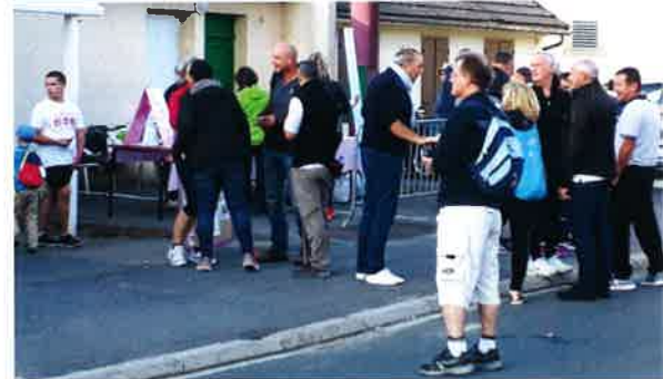
MARCHE ROSE beau succès au nombre de 1000 randonneurs cette année.