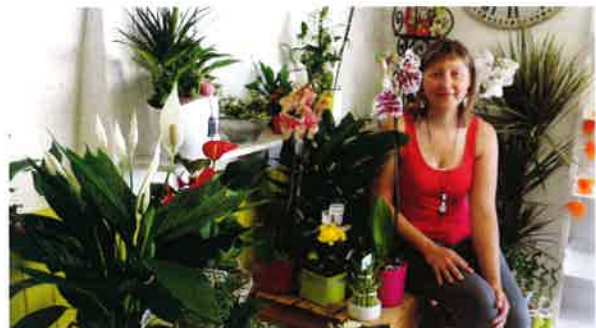
Un nouveau commerce à Damery (ANNE -FLEURS)