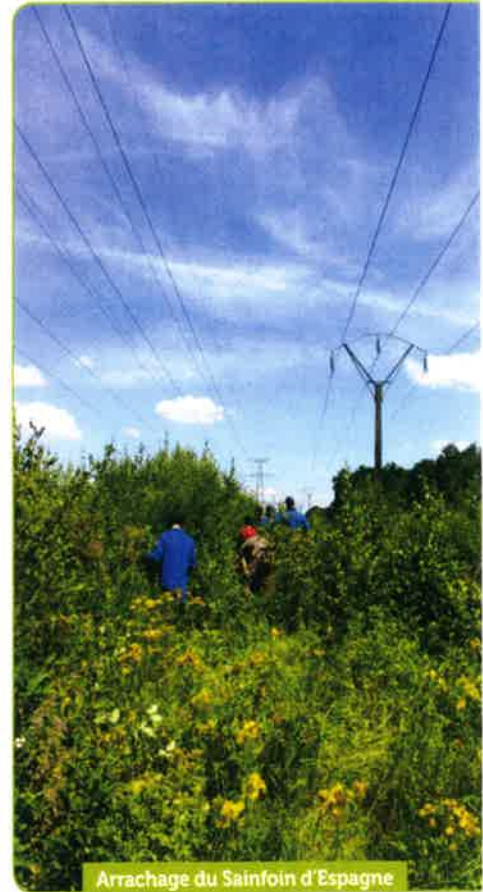
Arrachage du Sainfoin d'Espagne