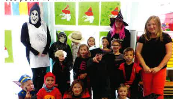
Le centre aéré fête Halloween.