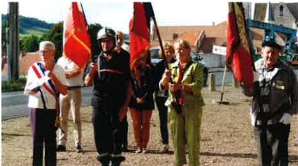
Commémoration de l'appel du 18 juin 1940.