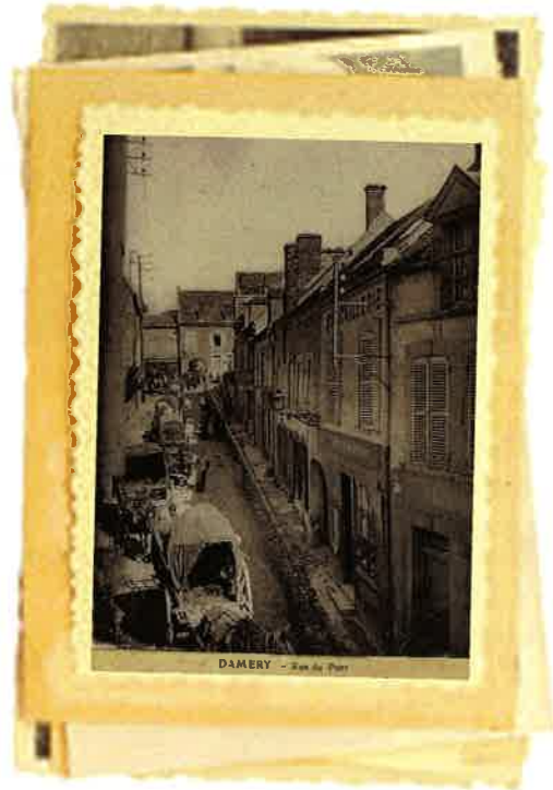
DAMERY - Rue de l'Église