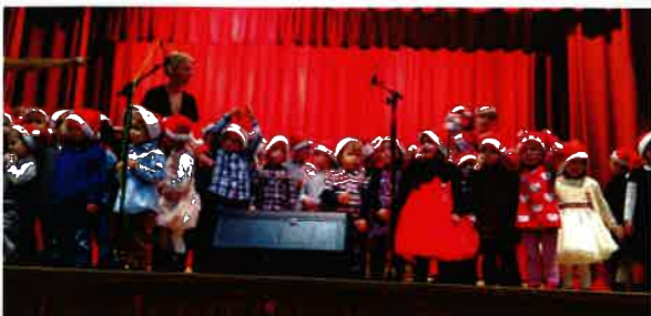
Le 18 décembre Soirée de Noël par la caisse des écoles.