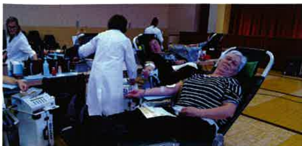
Le 27 octobre Le don du sang : 74 donateurs bénévoles.