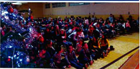
Le 9 décembre Après-midi de Noël organisé par le comité des fêtes.