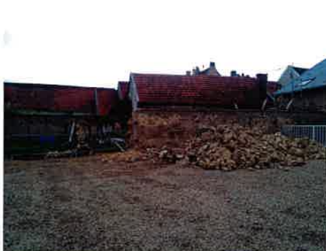
Reconstruction du mur du parc de l'hôtel de ville