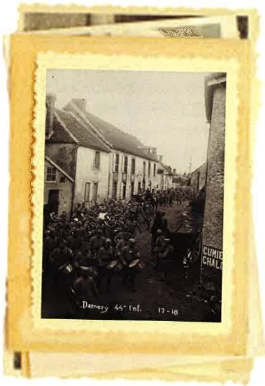
Damery 44 e Inf. 17-18