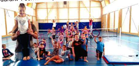
Le 20 juillet Initiation au cirque pour 28 enfants du centre aéré avec la Compagnie Korman de Courtisols.