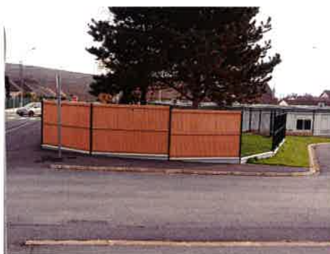
Clôture de la halte-garderie