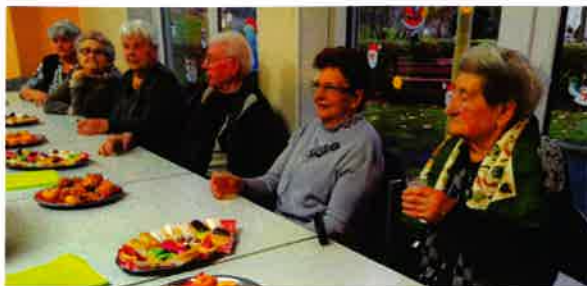
Le 10 décembre Résidence Le Parc, un goûter dans la bonne humeur.