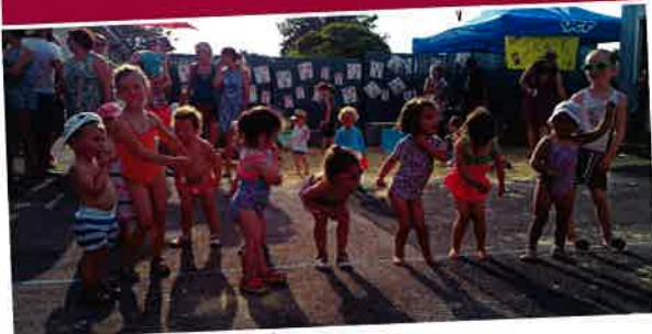
Vacances de juillet Les P'tites Frimousses, journée à la plage.