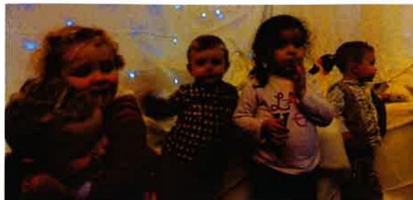
Le 10 décembre Noël chez les P'tites Frimousses.