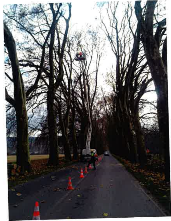
Élagage novembre 2015

▲ Travaux provisoires le long des platanes durant la période des vendanges, afin d'éviter que les gens du voyage s'y installent.