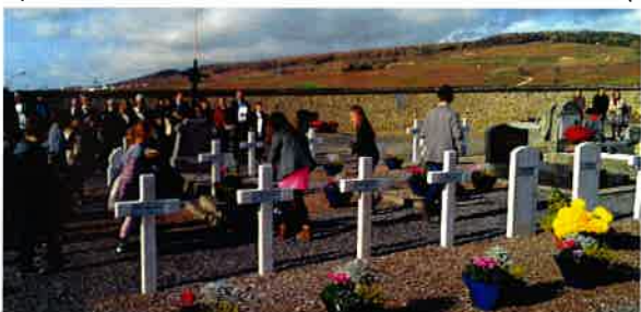
Le 11 novembre Cérémonie du 11 novembre, les enfants ont déposé des fleurs sur les 24 victimes du carré militaire du cimetière de Damery.