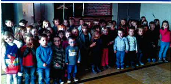
Le 12 novembre Les enfants de l'école maternelle ont participé au spectacle de marionnettes à fils de Pierre et le Loup.