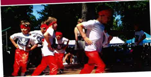
Le 28 juin Kermesse des enfants.