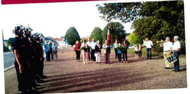
Le 28 août Commémoration de la Libération de Damery.