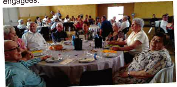
Le 4 juillet Repas des aînés.