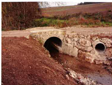
Installation conduite d'eau