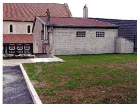
Aménagement place des écoles