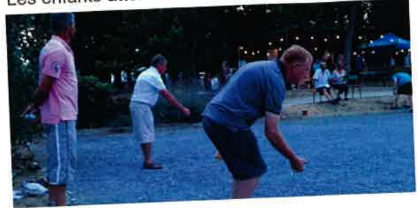
Le 18 juillet Concours de boules nocturne organisé par l'amicale des boulistes. 51 doublettes étaient engagées.