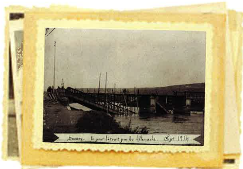
Damery - le pont de bois pour les Allemands. Oct. 1914