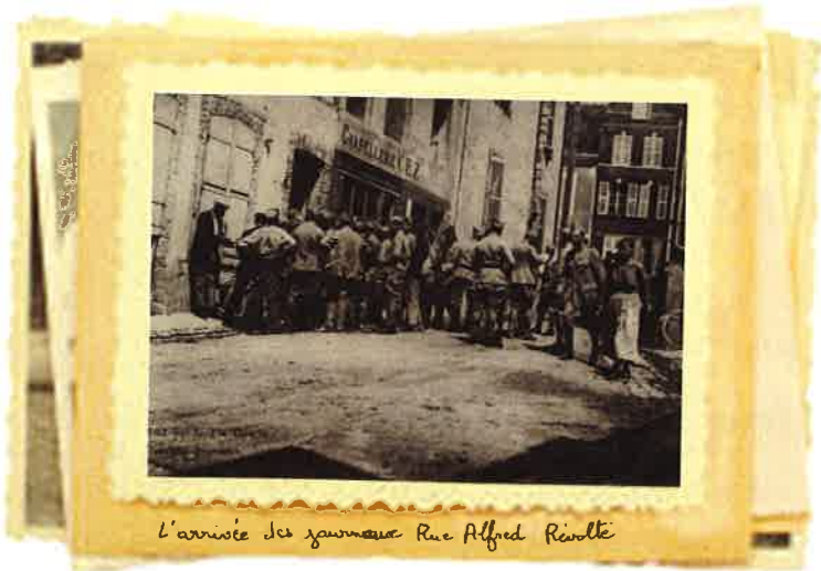
L'arrivée des zouaves Rue Alfred Réville