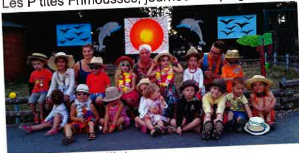
Vacances de juillet Le centre aéré ouvre ses portes avec 6 animateurs, durant 4 semaines pour 50 enfants de 4 à 12 ans.