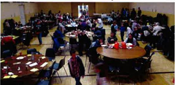
Le 21 novembre Loto de la coopérative de l'école élémentaire.