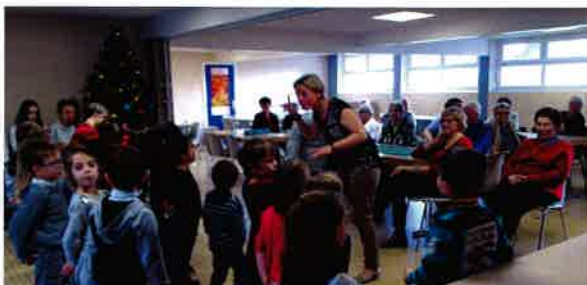
Le 17 décembre Les maternelles chantent pour le Renouveau.