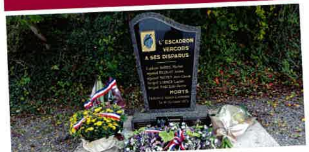
Le 19 octobre Hommage aux aviateurs disparus le 19 octobre 1971.