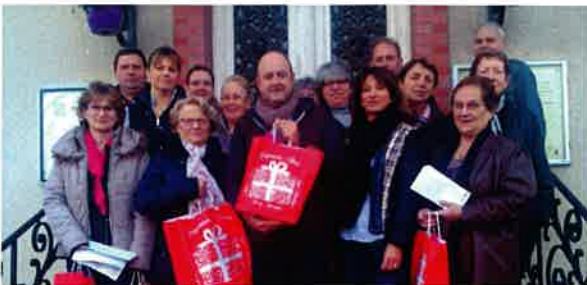
Le 19 décembre Colis pour les aînés.