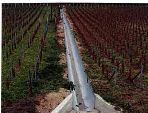
Descente d'eau sur le CD1