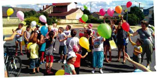
Le 14 juillet Les enfants attentifs durant le lâcher de ballons.