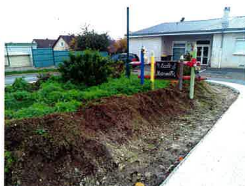
Aménagement devant la maternelle