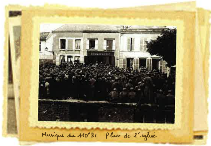
Musique du 110 e RI Place de l'église