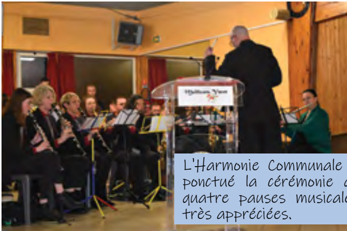
L'Harmonie Communale a ponctué la cérémonie de quatre pauses musicales très appréciées.