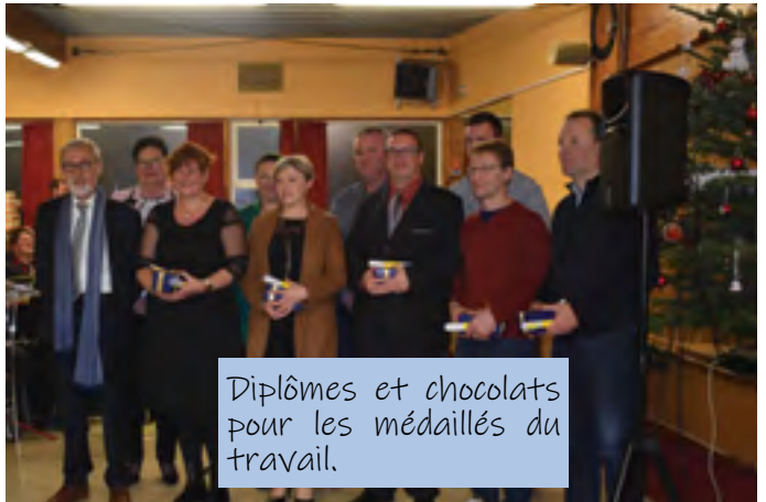
Diplômes et chocolats pour les médaillés du travail.