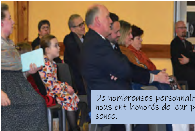
De nombreuses personnalités nous ont honorés de leur présence.