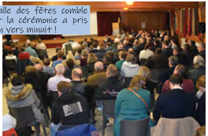
Salle des fêtes comble et la cérémonie a pris fin vers minuit !