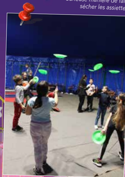
Curieuse manière de faire sécher les assiettes.