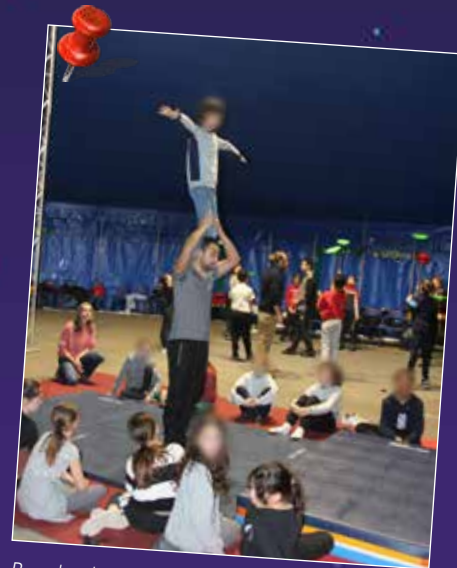
Prendre de la hauteur nécessite un minimum de concentration.