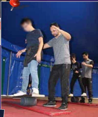
L'idéal est d'éviter d'arriver au bout du rouleau.