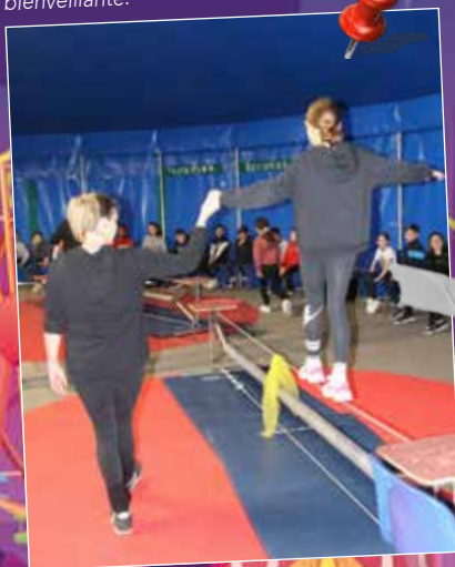
L'équilibre ne tient qu'à une main bienveillante.