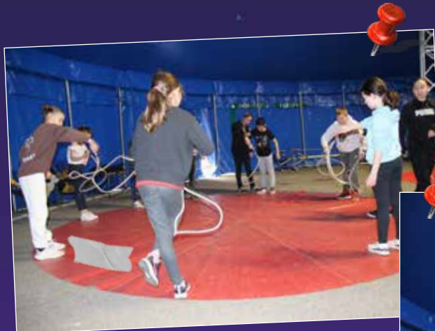
Le lasso reste un numéro inconditionnel pour exercer son habilité.