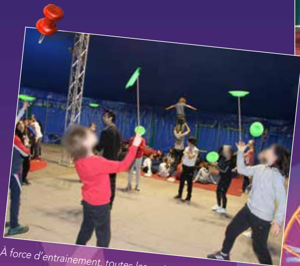
À force d'entraînement, toutes les assiettes virevoltent.