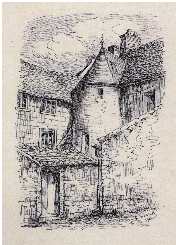
Une des maisons natales supposées de Jean

Malgré la présence d'un registre officiel, on ne saura donc sans doute jamais ni où ni quand Jean Racine est né !