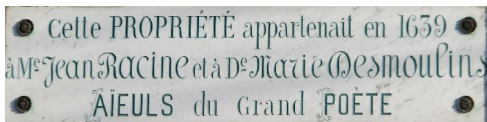
Plaque du 14 rue Saint-Waast