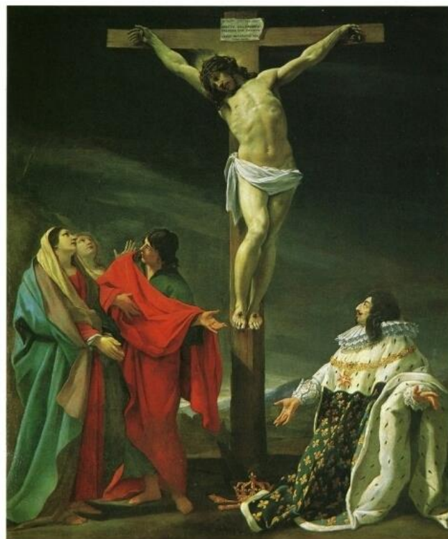
Le vœu de Louis XIII, Simon Vouet, 1633

Depuis la Réforme, les princes catholiques ou protestants se soulèvent à travers l'Empire des Habsbourg, nourrissant une terrible guerre qui va durer « Trente ans » (1618-48) et dans laquelle la France s'engage en même temps qu'elle lutte contre les Espagnols des Pays-Bas (qui progressent jusqu'à l'Oise en 1636).