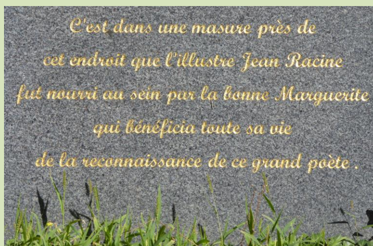
Plaque commémorative à Silly-la-Poterie