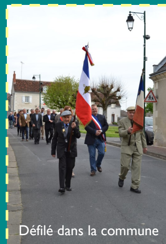
Défilé dans la commune