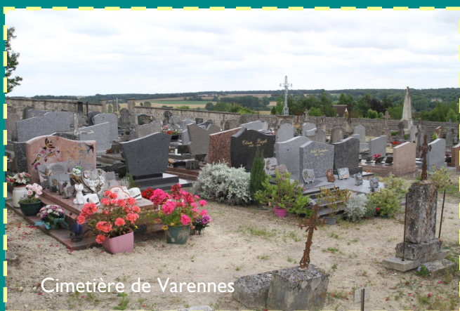
Cimetière de Varennes

Un nouveau « chantier » va être entamé concernant le cimetière de Varennes. Annoncé précédemment et mis en