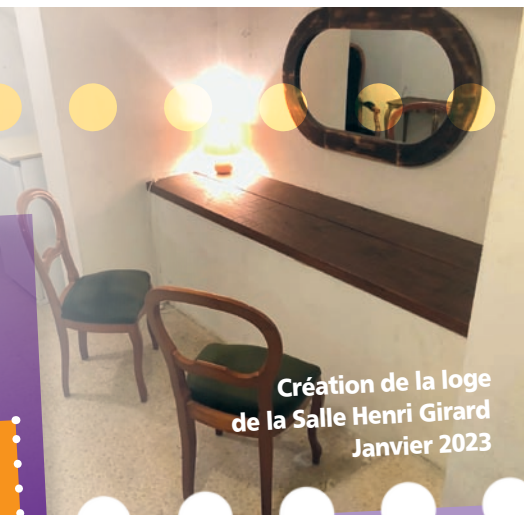
Création de la loge de la Salle Henri Girard Janvier 2023