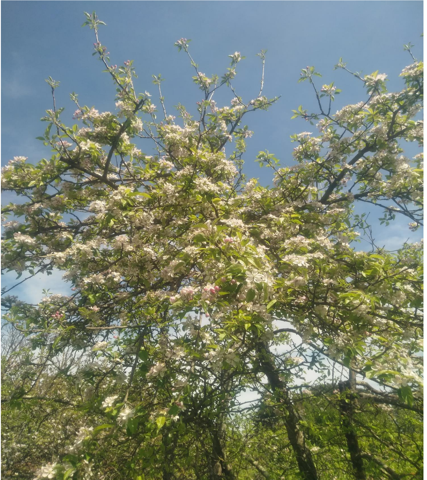
Pommier en fleur