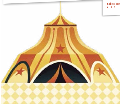
Illustration © Gwen Keraval

le sillon SCÈNE CONVENTIONNÉE D'INTÉRÊT NATIONAL ART EN TERRITOIRE